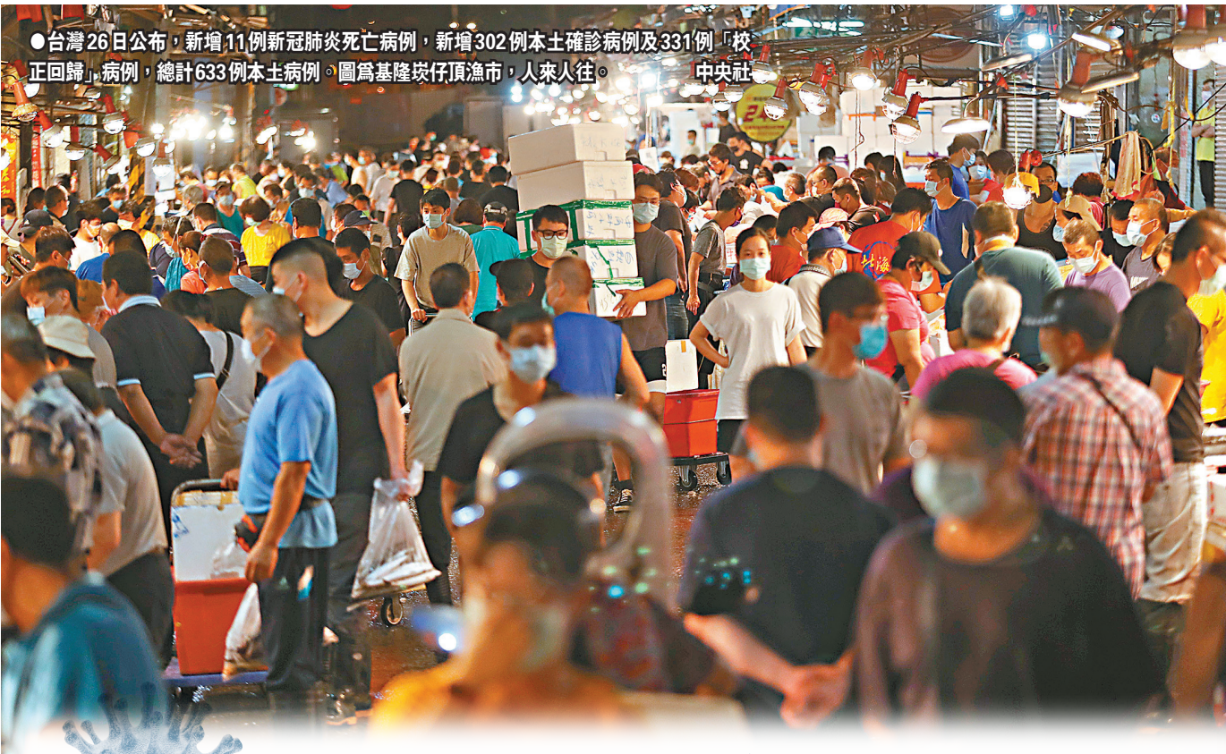
●台灣26日公布，新增11例新冠肺炎死亡病例，新增302例本土确诊病例及331例「校正回歸」病例，總計633例本土病例。圖為基隆炭仔頂漁市，人來人往。

香港文匯報訊 (記者 朱輝 北京報道) 26日，國台辦發言人朱鳳蓮在發布會上回應了有關台灣疫苗的系列問題。她指出，現在台灣同胞正在承受不斷增大的疫情壓力和危害，最新民意調查顯示，高達八成五的台灣民眾擔心家人感染新冠病毒，近半民眾願意立刻接種各種合格疫苗。民進黨當局應以台灣同胞生命健康安全為重，立刻停止針對大陸的政治操弄，去除人為的政治障礙，讓廣大台灣同胞盡快有大陸疫苗可用，早日渡過難關。