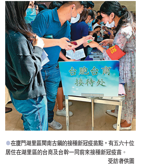
●在廈門湖里區閩南古鎮的接種新冠疫苗點，有五六位居住在湖里區的台商及台幹一同前來接種新冠疫苗。

世界最高。明眼人都能看出，以所謂「疫苗不安全」為由拒絕大陸疫苗入台，不過是民進黨當局大搞「疫苗雙標」、開展「政治防疫」的借口。文章最後指出，希望民進黨當局保有一絲良知，立即祛除「仇中抗陸」的「政治心魔」，盡快讓台灣同胞打上安全可靠的疫苗，避免更多的台灣同胞因疫情被迫付出生命健康代價，否則必將被釘在歷史的恥辱柱上，遭人唾棄！