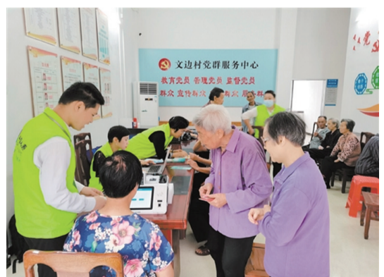
社保助老“e”服務項目助力老人享受更好的社保服務。

出門辦社保業務不方便、手機辦社保業務不會用，老年人在辦理社保業務時總是會遇到這樣的煩心事。爲解決老年人不會使用智能手機辦理社保業務、到鎮（街）公共服務中心行動不便等問題，4月，我市社保部門結合黨史學習教育“我爲群眾辦實事”實踐活動，與中國人壽江門分公司合作開展了江門市社保助老“e”服務項目。今後，全市近100萬名基本養老保險退休人員可在1316個村（社區）享受