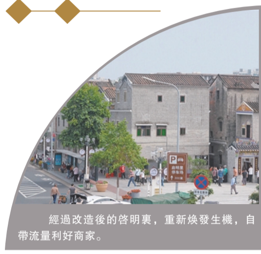
經過改造後的啓明裏，重新煥發生機，自帶流量利好商家。