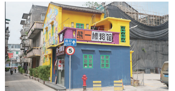
老建築變身“網紅”店，吸引不少人前來探店打卡。