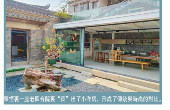
肇恒裏一座老四合院裏“長”出了小洋房，形成了傳統與時尚的對比。