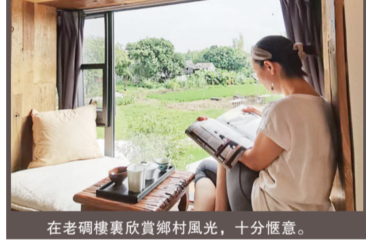
在老礮樓裏欣賞鄉村風光，十分愜意。