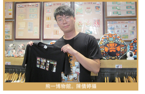
熊一博物館。陳倩婷攝