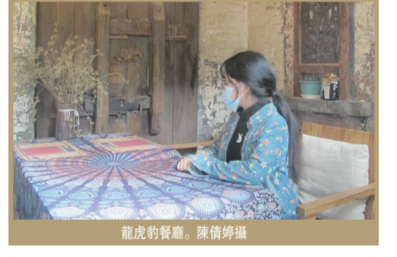
龍虎豹餐廳。