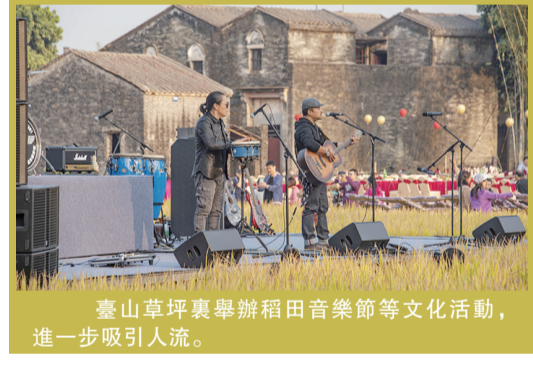
臺山草坪裏舉辦稻田音樂節等文化活動，進一步吸引人流。