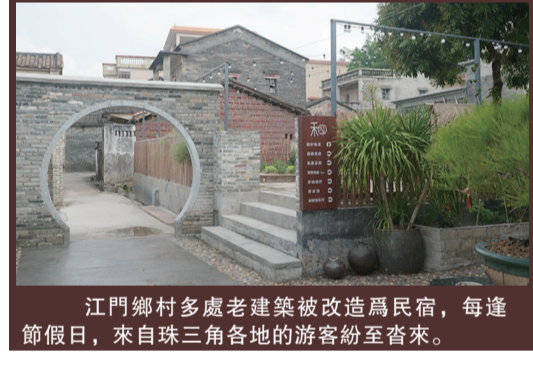
江門鄉村多處老建築被改造爲民宿，每逢節假日，來自珠三角各地的遊客紛至沓來。