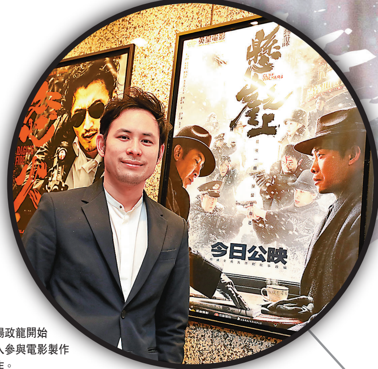
楊政龍開始投入參與電影製作工作。