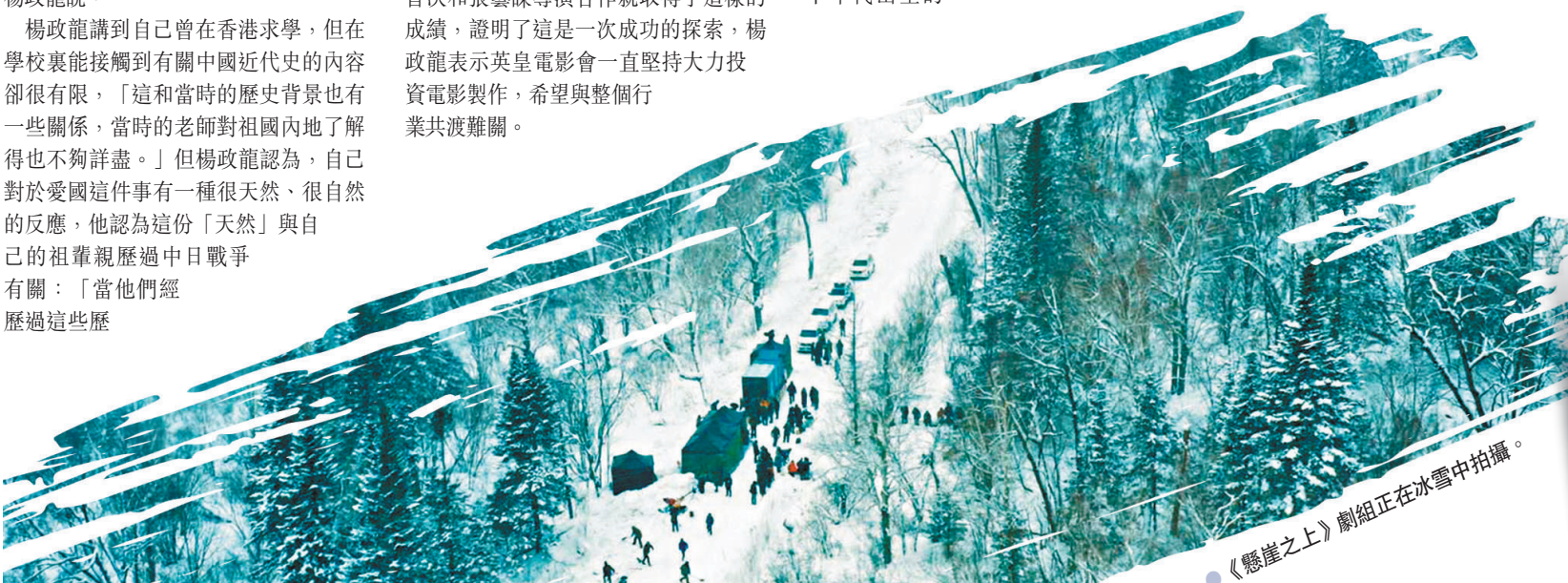
《懸崖之上》劇組正在冰雪中拍攝。