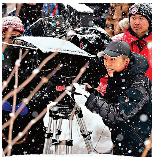
導演張藝謀再度挑戰自我，首次嘗試諜戰題材。

事實上，2018年楊政龍和父親楊受成博士與張藝謀導演初次會面，便一見如故，決定合作製作一部有社會意義的優質影片。而對於諜戰題材的探索，楊政龍一早就抱有期待：「內地在電視劇的製作上有很多優秀的諜戰題材作品，但近年電影市場裏『諜戰』的題材是很少的，而這次我們這個電影故事，相信作為觀眾在觀影期間會有很多好奇與猜測，它並非一部說教式的沉悶電影。」首次和張藝謀導演合作就取得了這樣的成績，證明了這是一次成功的探索，楊政龍表示英皇電影會一直堅持大力投資電影製作，希望與整個行業共渡難關。