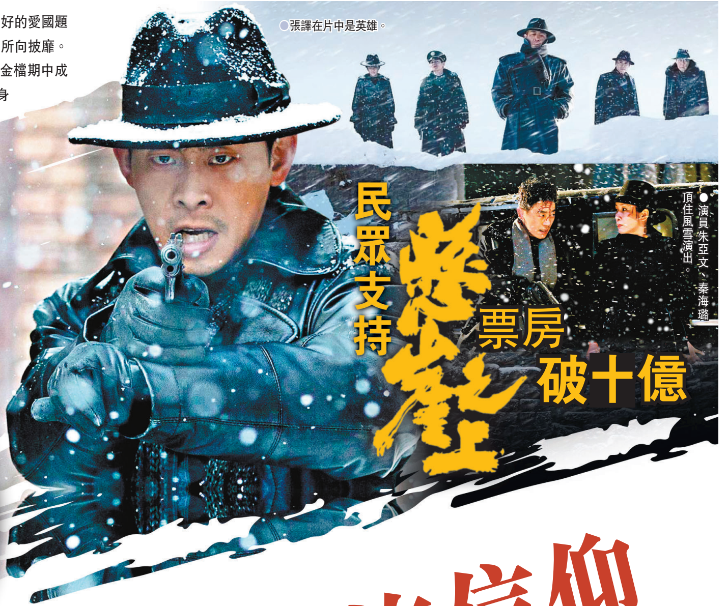
張譯在片中是英雄。

繼《紅海行動》、《金剛川》及《我和我的祖國》等叫座又叫好的愛國題材電影摘得累累碩果，英皇電影集團今年再次憑借主旋律題材影片所向披靡。由張藝謀執導的諜戰片《懸崖之上》現正熱映，該片在內地五一黃金檔期中成為領跑票房的贏家，上映21日後突破10億元人民幣票房，不僅躋身2021年中國電影票房TOP 5，更在各電影評論網站上得到了大量褒獎。英皇電影副主席、該片總策劃楊政龍日前接受香港文匯報專訪時表示對有此成績感到欣慰和感動，「因為中國人的愛國情懷，決定了這種展現為國家、民族奉獻的電影一定會成功！」 採訪：香港文匯報記者 胡茜