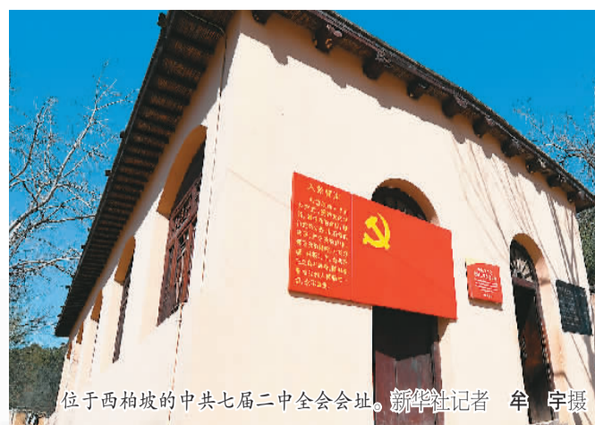
位于西柏坡的中共七届二中全会会址。