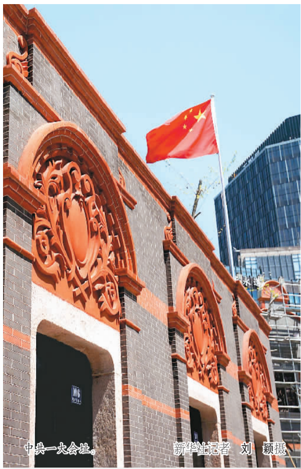
中共一大会议址。