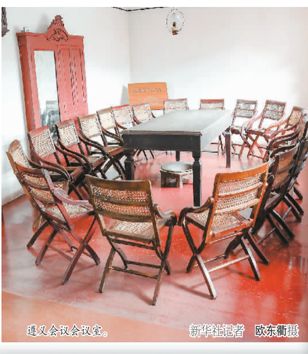
遵义会议会议室。