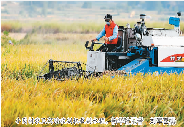
小岗村农民驾驶收割机收割水稻。

中国共产党，从50多人发展到超过9100万党员，百年沧桑。从萌芽，到创建，再到星星之火，再到燎原之