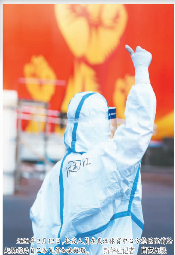
2020年2月12日，抗疫人员在武汉体育中心方舱医院前竖起拇指为自己和同伴加油鼓劲。

如今，谁要跑到中国来看一看，会发现中国共产党百年来所致力于创造的，正是自由光明的新天地。