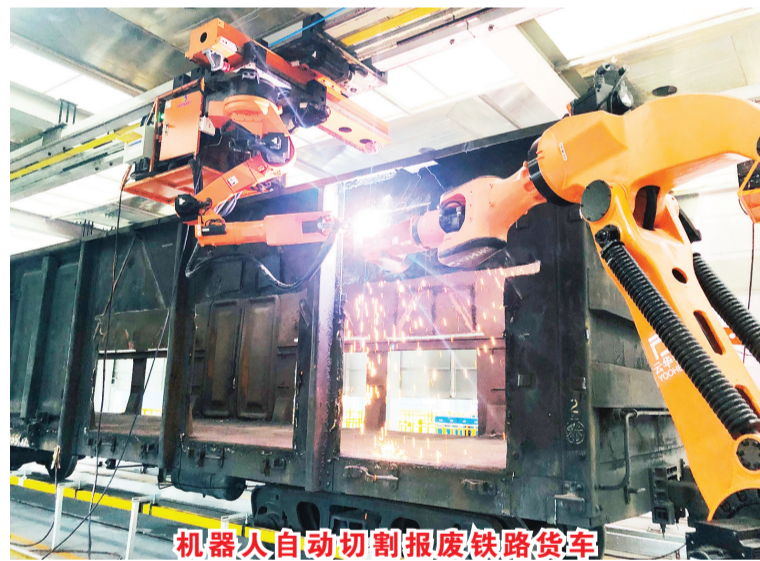
机器人自动切割报废铁路货车