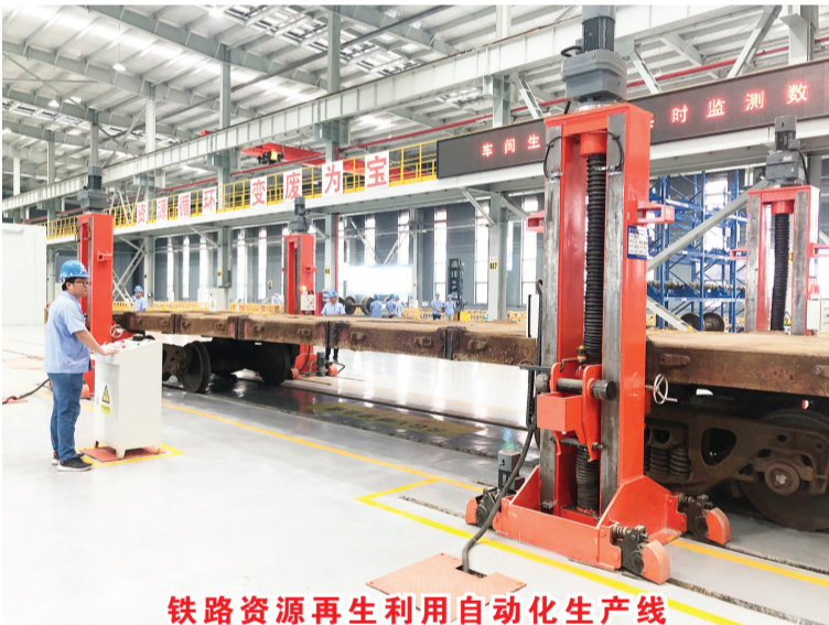
铁路资源再生利用自动化生产线