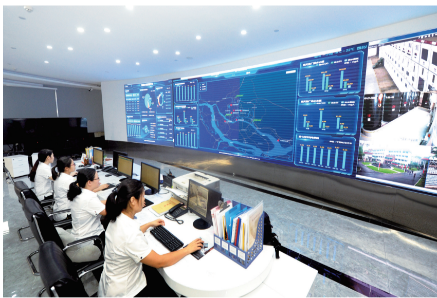
福州水务打造数字水务新标杆。

福州市城乡建设局相关负责人表示,将以项目整体通过初步验收为契机,在水系治理理念路径、模式、手段等方面大胆创新,加快构建水安全、水资源、水环境、水生态、水经济、水文化等体系,进一步锤炼现代化的治水管水能力,不断增强人民群众对良好生态环境的