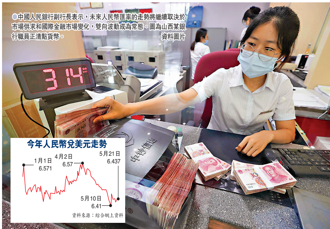
●中國人民銀行副行長表示，未來人民幣匯率的走勢將繼續取決於市場供求和國際金融市場變化，雙向波動成爲常態。圖爲山西某銀行職員正清點貨幣。

香港文匯報訊 (記者 海巖 北京 報道) 在國際大宗商品價格過快上漲的背景下，市場近期對人民幣升值的呼聲升溫。繼金融委會議明確表示要保持人民幣匯率在合理均衡水平上的基本穩定後，中國人民銀行副行長劉國強週日(23日)表示，未來人民幣匯率的走勢將繼續取決於市場供求和國際金融市場變化，雙向波動成爲常態。 劉國強強調，人民銀行將注重預期引導，發揮匯率調節宏觀經濟和國際收支自動穩定器作用，保持人民幣匯率在合理均衡水平上的基本穩定。