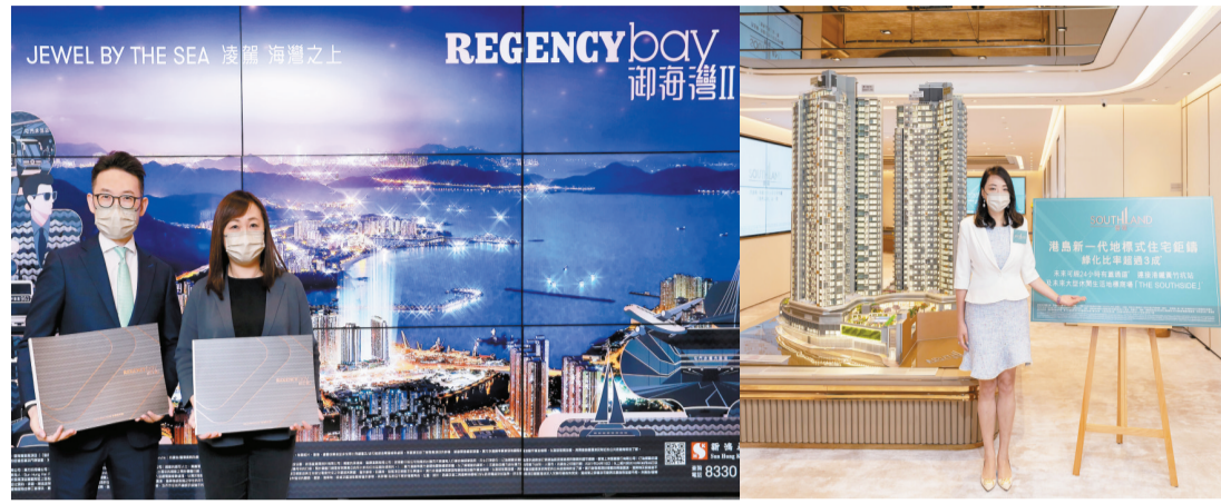
過去周末御海灣II及晉環兩大樓盤均有銷售活動。

【香港商報訊】記者鄭珊珊報導：剛過去周末未有全新盤推售，僅得兩個新盤有新一輪銷售活動，一手樓市況回軟，新盤成交普遍轉弱。有市場人士認為，新一期居屋申請或短暫搶去一手私樓部分客源。