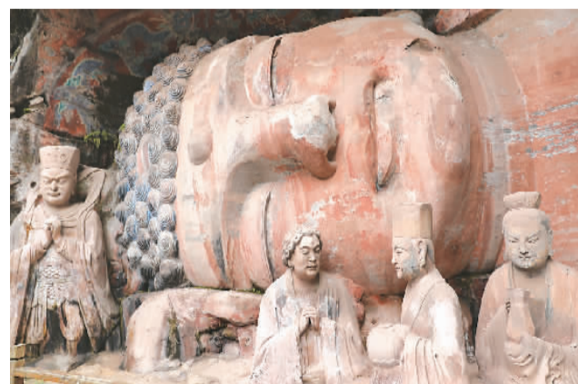
上图：长期暴露在露天环境中的卧佛出现不同程度的损伤，亟待修复。下图：文物修复人员对卧佛摩崖造像进行风化程度跟踪监测。

经过残损石刻造像的现场试验性保护修复、试验性保护修复效果跟踪监测等工作，文物修复人员已经制订出了全面保护修复实施方案，大足石刻卧佛修复即将进入最后阶段。