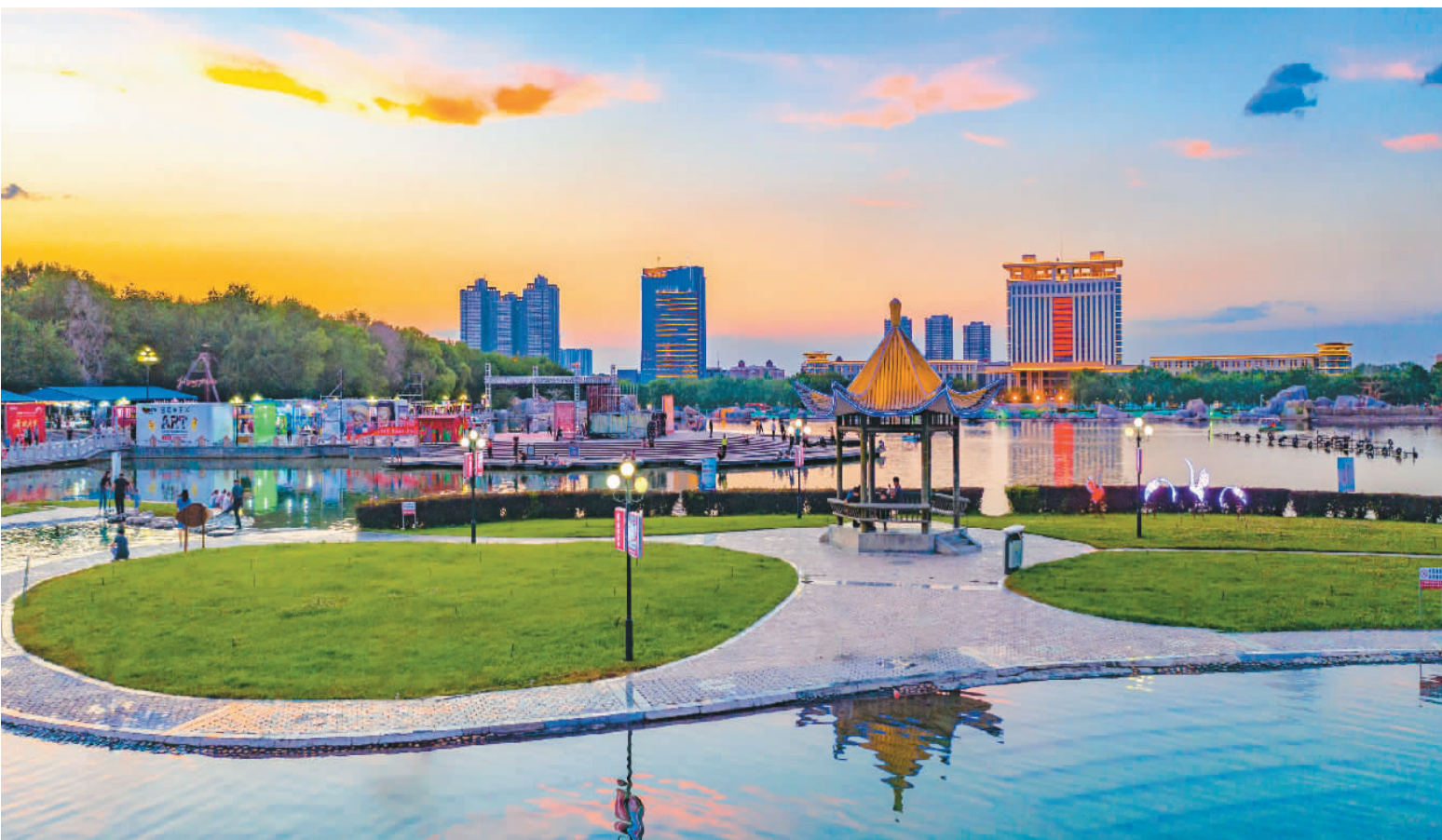
图为石河子市明珠湖。