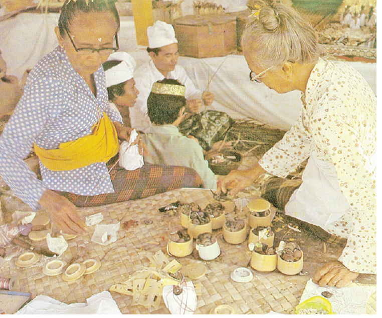
作为门得姆礼(Mendem Pedagingan)仪式上的神器的铜钱。每百年才在伯沙基庙(Pura Besakih)举办一次的艾卡达萨鲁德拉百年祭典。

典中,铜钱仍然作为宗教仪式的祭品(Sarana)被广泛使用。祭神礼是为天神上玄威迪瓦沙(Sang Hyang Widhi Wasa),即无上神主举办的祭典。在门得姆礼(Mendem Pedagingan)要要建立供奉塔(Bangunan suci)时必须用到铜钱。 圣人礼(敬奉所有的修道者,隐士和印度教学者),敬奉所有的圣人,包括修道者和隐士。敬奉方式为在宗教祭典仪式结束后赠予钱财。如今,一般所赠予的不再是铜钱,而是印尼盾币。 祈灵礼(祭奠祖先亡灵),祭奠祖先亡灵以表达对祖先的尊敬和孝顺。铜钱会在色加罗拉(Sekarura),尺子(Ukur),鲜花碑(Puspa Lingga),竹伞(Payung Kekecer)等一些祭物品中使用。 祷礼(为人类献祭),向所有人类同伴进贡以净化身体和灵魂,达到极简状态。婚礼,三月礼(Telu Bulanan),小孩初次踏地仪式(Turun tanah),半年礼(Otonan),搓牙仪式(Potong Gigi),和净化礼(Upacara Pawintenan)都会用到铜钱。 避邪礼,旨在把神圣的祭品敬奉给邪灵,以换取安宁。在村祭(Pecaruan)和祭邪( Mesegeh)过程中会使用到铜钱。 中国铜钱在宗教仪式中的存在 峇厘印度教徒倾向使用中国铜钱的原因有几个。人们普遍认为这是因为受到印度教圣典、哲学、神圣、(社会)观念以及铜钱功能等各方面的影响。 圣典