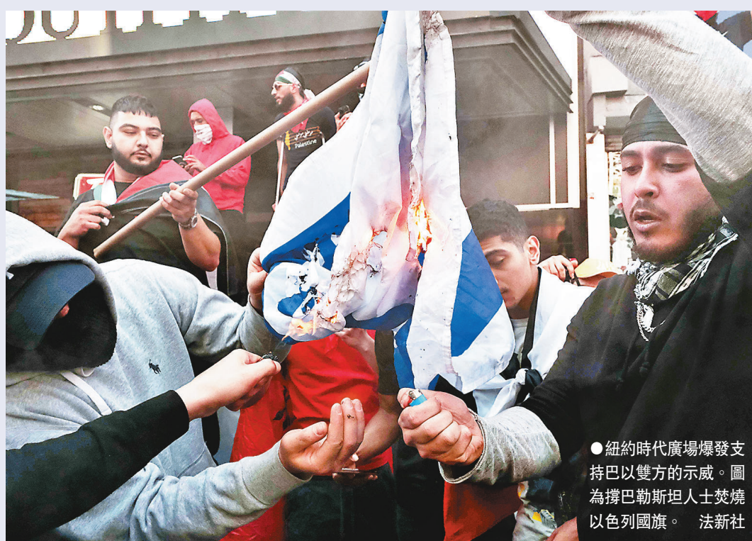
●紐約時代廣場爆發支持巴以雙方的示威。圖為擯巴巴勒斯坦人士焚燒以色列國旗。

關注網絡權利的Access Now表示，fb審查受政治因素影響，針對巴以衝突相關帖文的準則「不透明和不公平」，導致很多合法的內容被標籤或直接被刪除，批評現時審查機制明顯存在偏見。 ●綜合報道