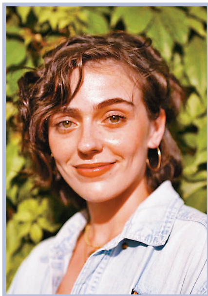
●懷爾德因發表聲援巴勒斯坦人的帖文，遭美聯社開除。

美聯社一名猶太裔記者在近日巴以衝突期間，在社交媒體發表聲援巴勒斯坦人的帖文，遭到霍士新聞台等多間美國右翼傳媒炮轟，美聯社隨即以「違反社媒政策」為由解僱她。多名知名記者批評在自家記者飽受騷擾時，美聯社不單未有給予支持，更懷疑屈從於政治壓力而決定解僱，斷送該名記者的職業生涯。