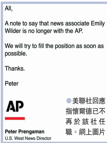
●美聯社回應指懷爾德已不再於該社任職。