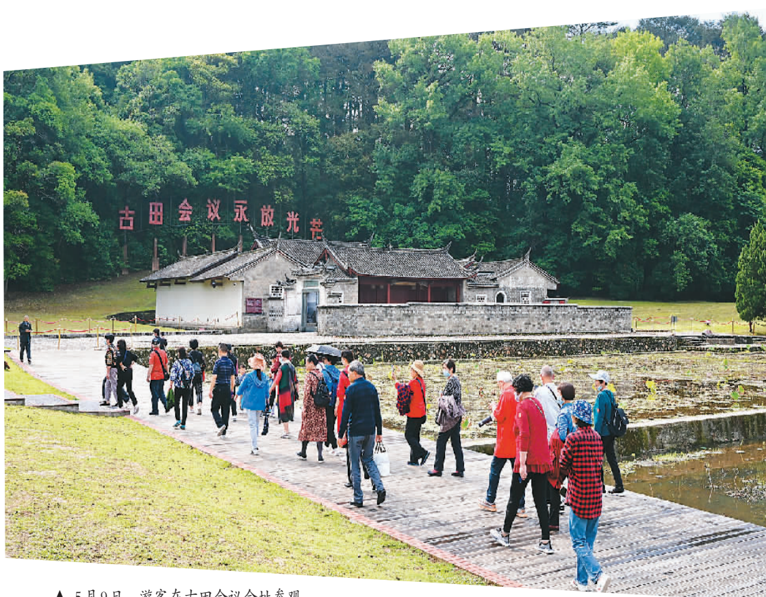
▲ 5月9日，游客在古田会议会址参观。