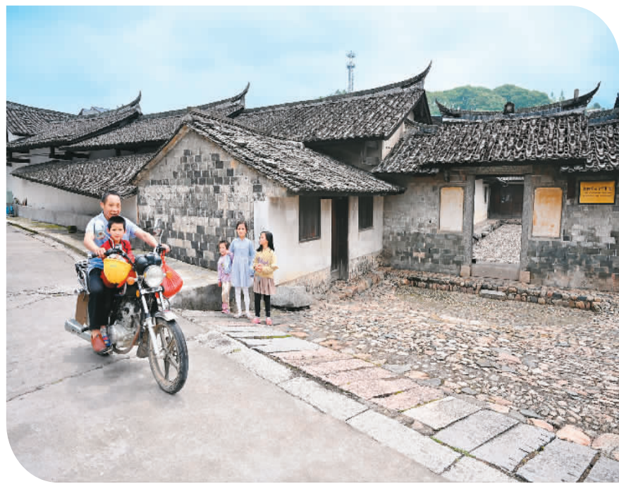
► 5月9日，居民骑车经过位于古田镇八甲村的红四军司令部旧址。

多年来，上杭县发挥红色古田的独特优势，持续加大对古田会议会址、红四军司令部旧址、毛泽东《星星之火，可以燎原》写作地旧址等革命旧址群的保护与利用，推进红色培训、红色旅游、红色研学“三红”产业发展。同时不断增强红色旅游的辐射带动作用，立足当地良好的生态环境和“村在景区中、景点在村中”的实际，发展全域旅游，推动乡村振兴。如今的古田镇“处处是景观、村村是景点”，持续发展的红色旅游让当地百姓在家门口吃上“旅游饭”，人民群众的获得感、幸福感、安全感显著提升。