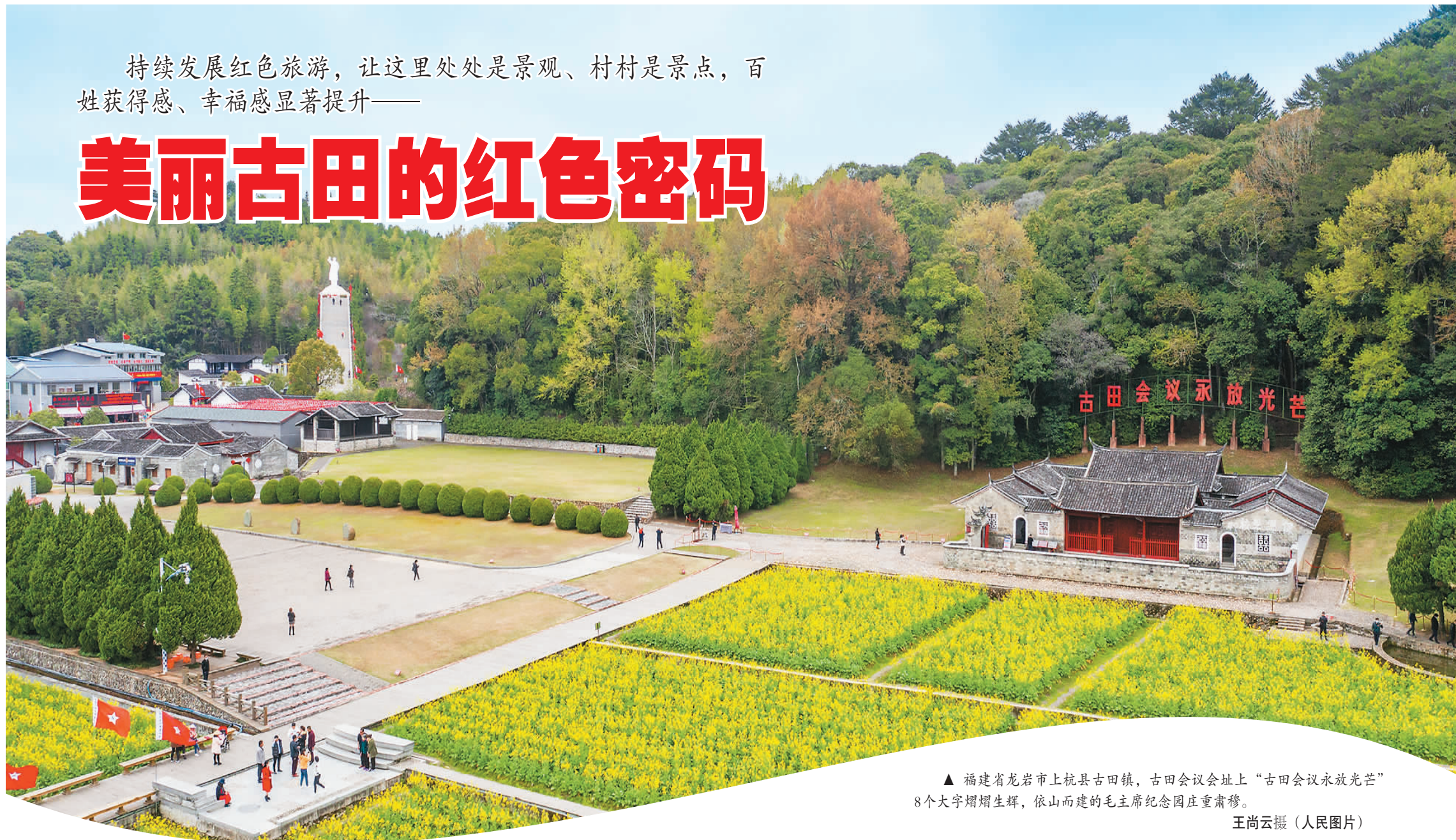
▲ 福建省龙岩市上杭县古田镇，古田会议会址上“古田会议永放光芒”8个大字熠熠生辉，依山而建的毛主席纪念馆庄严肃穆。