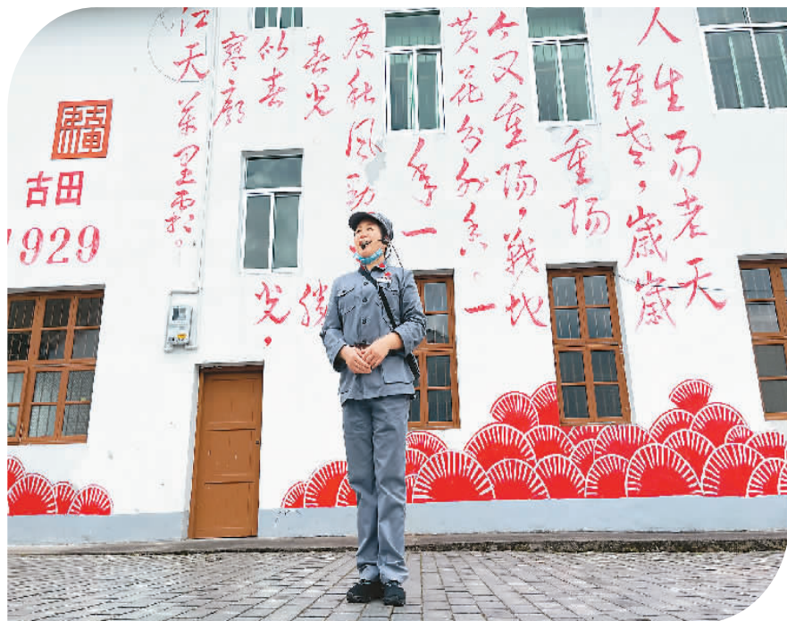
▲ 4月21日，一名讲解员在古田“红军小镇”讲解。