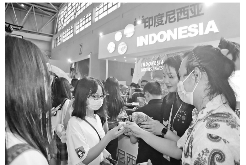
重庆国际投资贸易洽谈会的印尼馆

第三届中国西部国际投资贸易洽谈会于今年5月20日至23日在中国重庆市举办，我国有关单位受邀参展。