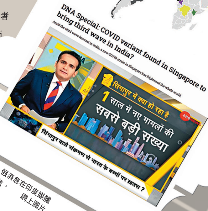
● 假消息在印度媒體擴散。網上圖片