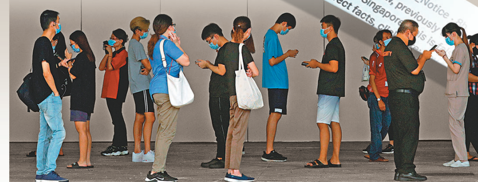
● 疫下資訊傳播更需要把關。路透社