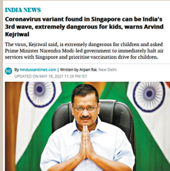
Delhi chief minister Arvind Kejriwal on Tuesday warned the Centre of a new variant of coronavirus disease (Covid-19) found in Singapore and said...

新加坡衛生部重申，所謂的「新加坡變種毒株」並不存在，也沒有證據顯示任何變種毒株「對兒童非常有害」，當地最近數周有多宗確診患者都是感染源自印度的「B.1.617.2」毒株。發言人說，新加坡發現該毒株前，該毒株已經在印度出現並傳播。