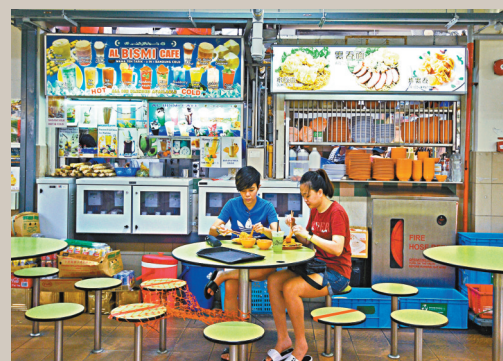
● 假新聞法有助政府抗疫。新華社

去年新加坡大選期間，辦公室也先後發送20項指示，要求澄清各項錯誤訊息。新加坡民主黨主席比亞去年7月聲稱，外籍勞工接受病毒檢測的決定「沒有徵詢衛生專家建議」，辦公室亦向報道該新聞的亞洲新聞台等傳媒機構發送更正指示。