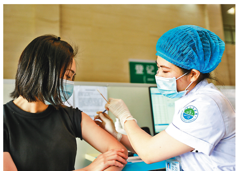
深圳新冠病毒疫苗接種破1千萬劑次。 資料圖片