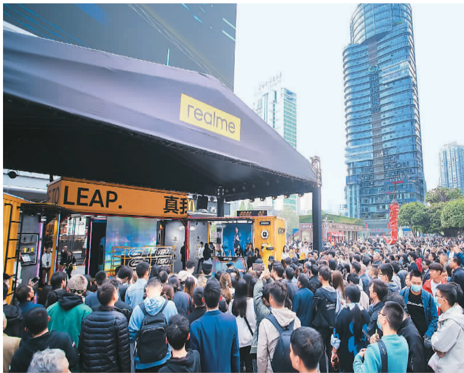
◀4月8日，真我在重庆举办新品快闪活动。 ▼真我手机主板组装车间。

为推动5G手机尽快落地，早在2016年，一加便成立了5G项目，不断增加投入，加大国际合作力度。一加相关人士表示，会在继续深耕高端市场、巩固品牌护城河的同时，顺应企业发展需要，逐步扩展企业发展边界，发力线下市场，驱动渠道、产品线、AIoT三驾马车齐头并进，进一步扩大在国内主流市场的布局。