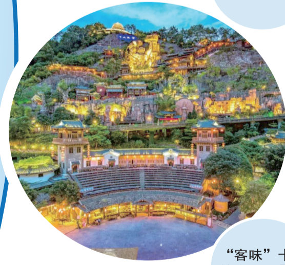
“客味”十足的客天下景區