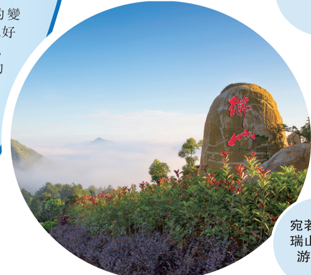
宛若仙境的瑞山生態旅遊度假村