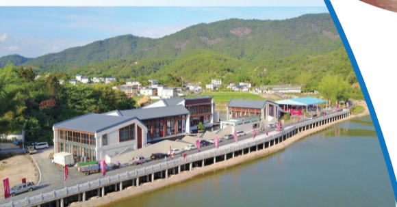
張弼士博物館就建立在其故居光祿第旁