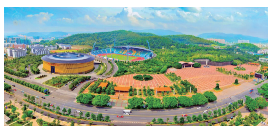
具有濃郁客家風情的梅縣新城

“山美、水美、人更美”！梅州的生態美、環境美和人之美，讓客都梅州充滿着無限的魅力和生機，也讓梅州在國際自然醫學學會評定的“世界八大長壽鄉”中高占兩席，成為名副其實的世界長壽之都。