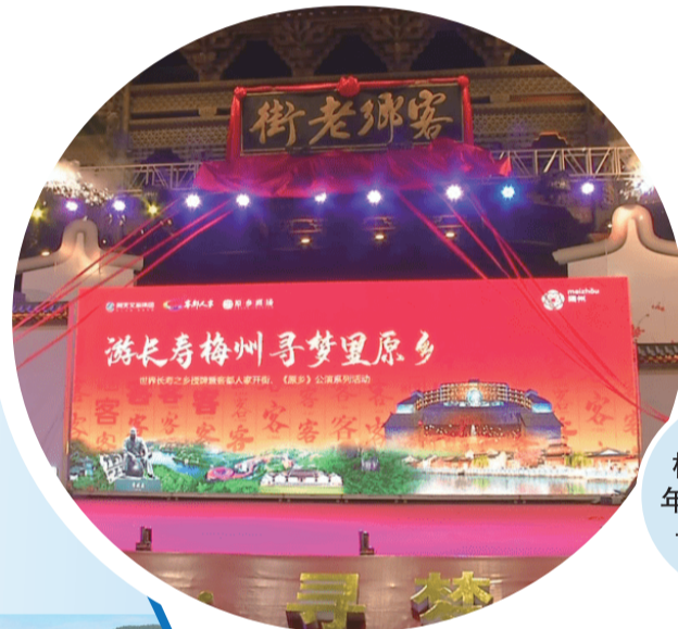
梅州于2020年獲評“世界長壽之都”