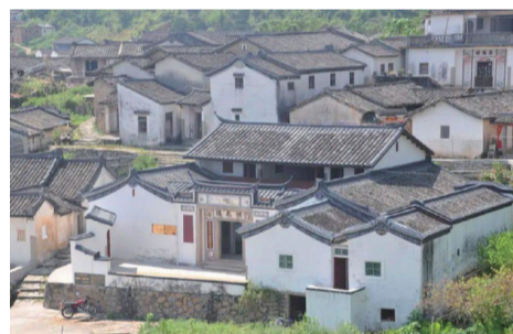
田家炳祖居拱辰樓