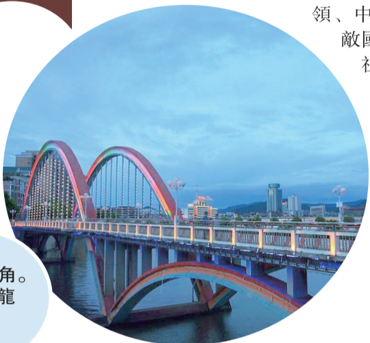
梅城一角。圖為德龍大橋