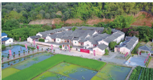
張弼士故居光祿第