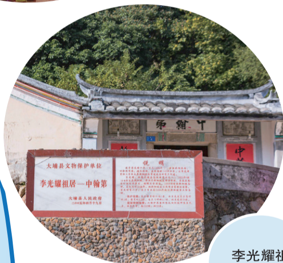
李光耀祖居中翰第

客家人的熱情好客、樂善好施，深為外界稱道。家裏有好吃的、好喝的，平時都不捨得自己享用，通常都是留作招呼客人。此外，客家人大都心地善良、樂於助人。這種美德，一直傳承至今，極為難能可貴。