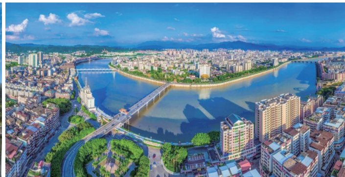
溫柔的梅江水穿城而過