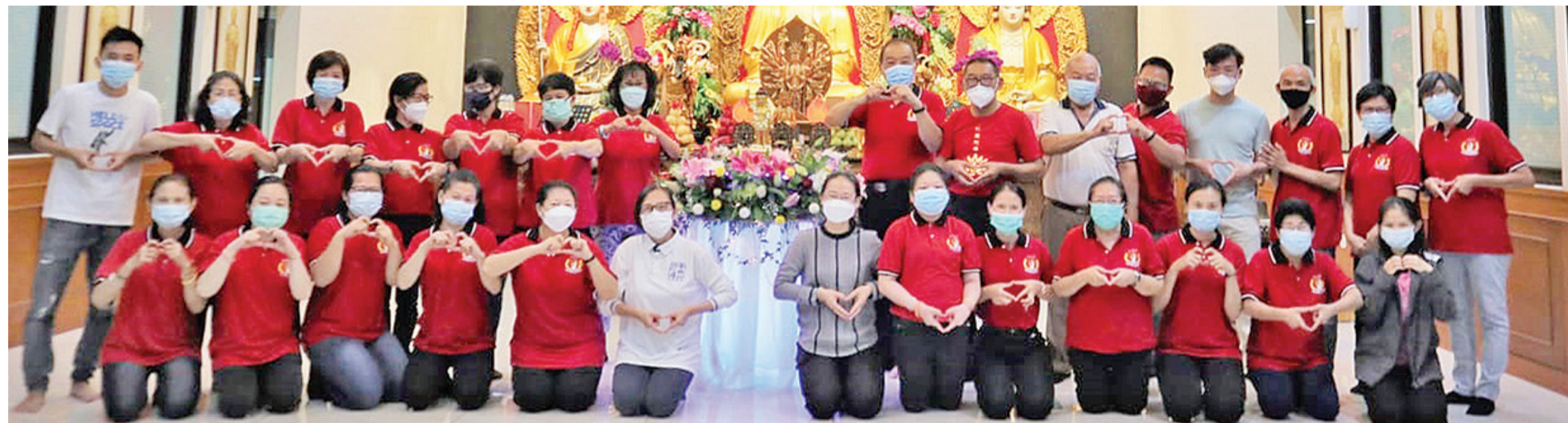
印尼广化万佛寺理事和义工合影