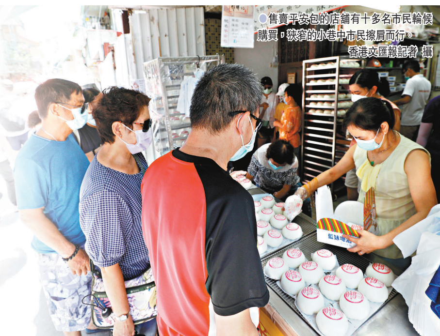
●售賣平安包的店舖有十多名市民輪候購買,狹窄的小巷中市民擦身而行。