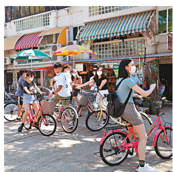
●有市民聯群結隊到長洲踩單車。

長洲部分人氣小店依然座無虛席,有小吃店安排位置供客人進食,但未有設置隔板,食客五六人搭枱用膳,