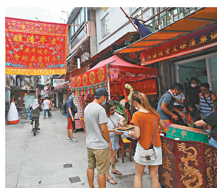
●長洲人流明顯減少。

他指由於今年天氣炎熱,而且大部分節目取消,只有前來參拜的老顧客及準備送禮的客人光顧,因此入貨亦同樣減少兩成。他續說,以往遊客生意佔三成,其餘都是本地人,現時外地人不便到港,有市民會購買平安包寄往內地,可見平安包在遊客眼中有一定市場,相信日後適關會對生意有一定幫助。