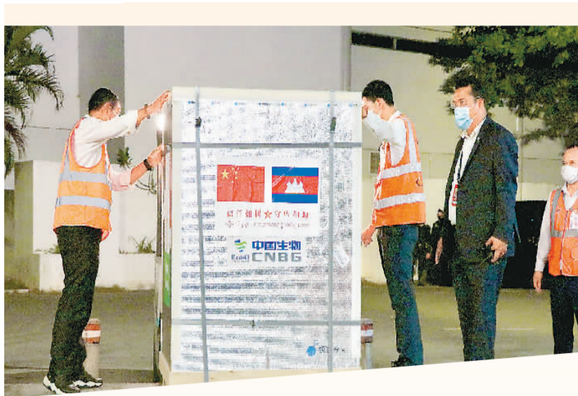
3月31日，工作人员在柬埔寨金边国际机场搬运中国援柬新冠疫苗。