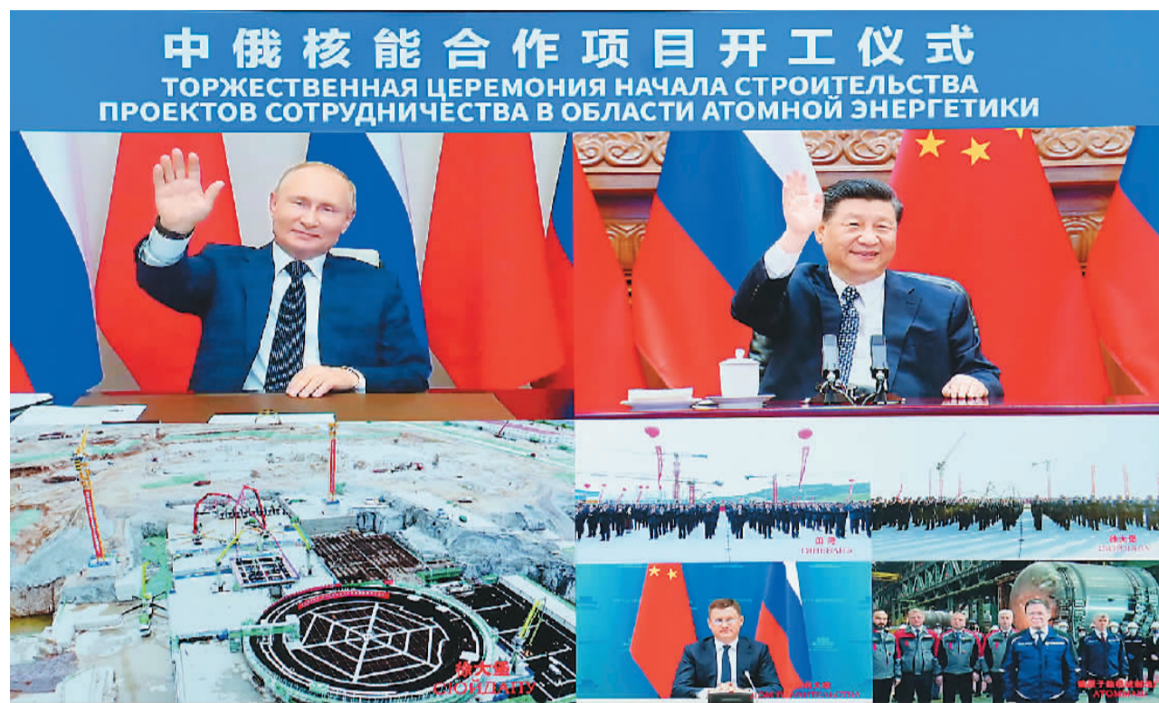
5月19日下午, 国家主席习近平在北京通过视频连线, 同俄罗斯总统普京共同见证两国核能合作项目——田湾核电站和徐大堡核电站开工仪式。