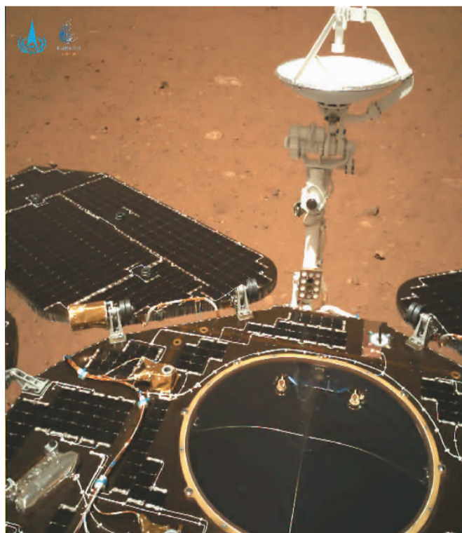
国家航天局发布天问一号着陆过程两器分离和落火影像。该图由导航相机拍摄, 镜头指向火星车尾部。

新华社北京5月19日电 (记者胡喆) 5月19日, 国家航天局发布我国首次火星探测任务天问一号探测器着陆过程两器分离和着陆后火星车拍摄的影像。图像中, 着陆平台驶离坡道以及祝融号火星车太阳翼、天线等机构展开正常到位。