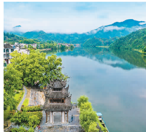
近年来, 安徽省黄山市歙县严格落实河长制, 配备专职保洁人员, 明确河段责任, 确保河道洁净、岸绿景美。图为5月14日, 歙县徽城镇南屏村水域生态景观。

陆丰14-4中心平台由上部组块和导管架两部分组成, 矗立在145米水深的大海上, 总高度达218米, 相当于70层楼高, 总重量近3万吨。