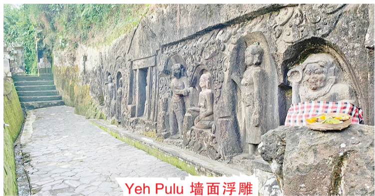
Yeh Pulu 墙面浮雕

7.墙面浮雕透视古代生活场景—Yeh Pulu 墙面浮雕 (Yeh Pulu 建议停留时