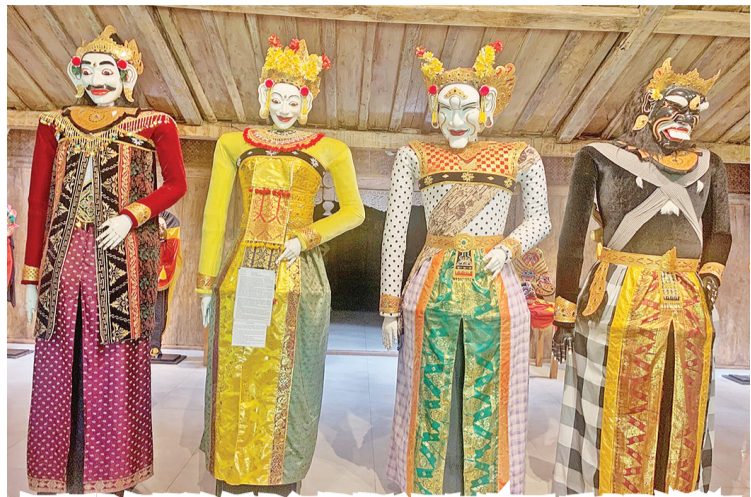
面具木偶博物馆中江婧薇和国王查亚·庞古斯雕像

6.欣赏来自世界千种面具木偶—Setia Darma 面具木偶博物馆 (Setia Darma House of Mask and Puppets 建议停留时间90分钟)