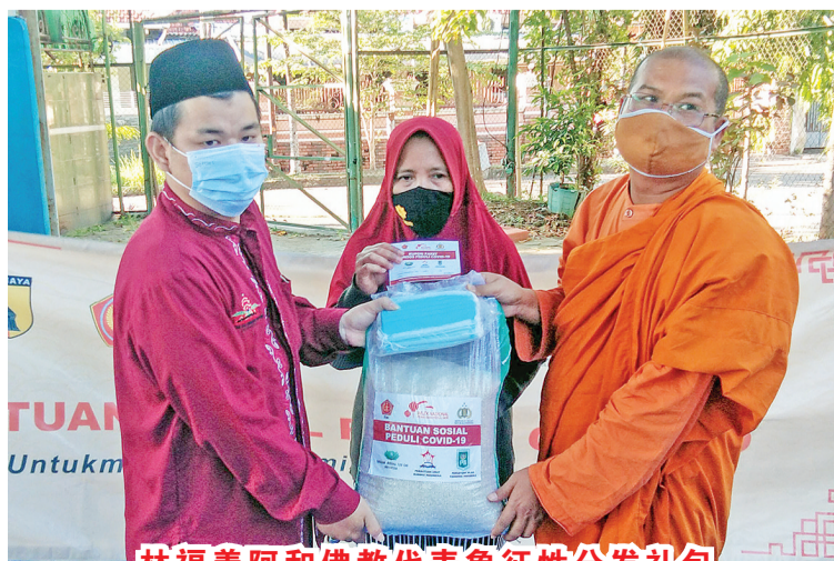
林福善阿和佛教代表象征性分发礼包