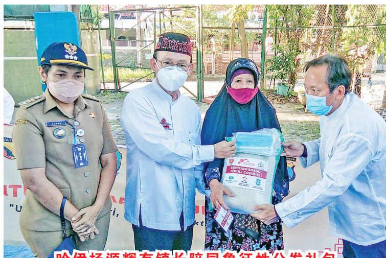
哈伊杨源辉有镇长陪同象征性分发礼包

此前,企业家关心国家协会还通过东爪哇省INTI向泗水的许多地方分发了数百份礼包予弱势的居民。 (Anto Tse/HK)