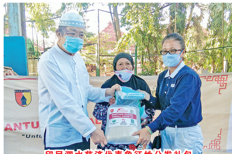
印尼泗水慈济代表象征性分发礼包