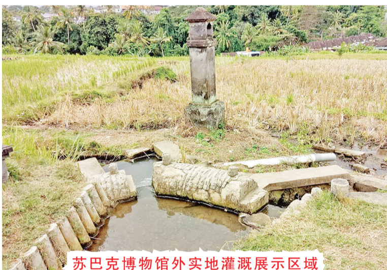
苏巴克博物馆外实地灌溉展示区域

以秉承巴厘岛"三合一"(人与自然,人与人及人与神和谐)的哲学理念为农作物提供了灌溉的功能,同时也构建了一套复杂的人造生态系统。