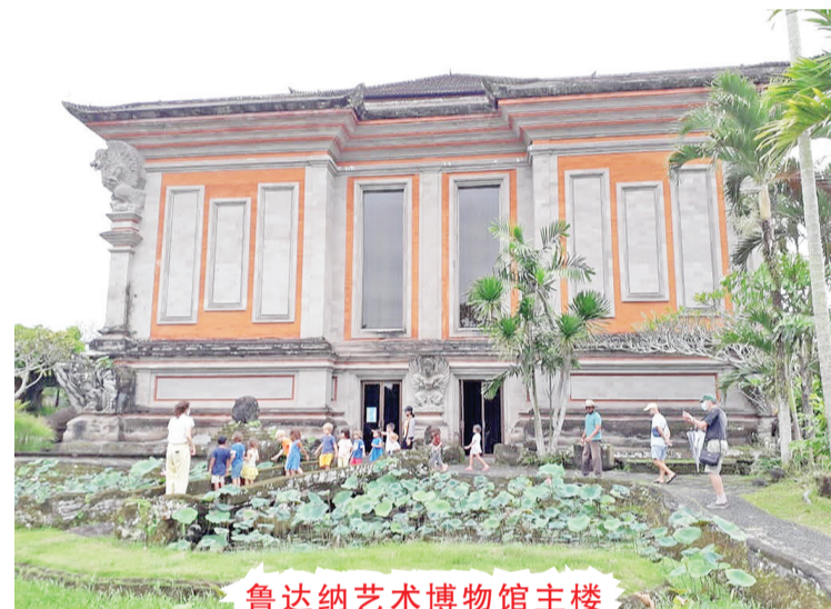
鲁达纳艺术博物馆主楼

Yeh"意为水或泉水;Pulu指石米或水容器,合意为用容器对圣泉中的使用。短暂到访之际去感受稻米与水息息相关的互联,并目睹古代巴厘