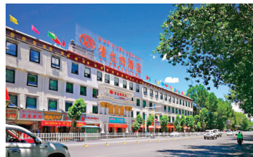
●在拉薩投宿的旅館。