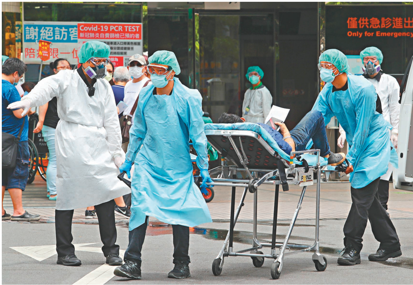
● 新北市板橋區亞東醫院17日爆出院內傳染案件，共有7人確診。目前門診降載且住院病人只出不進，僅收由急診進入的急重症病患，全院醫護防護升級。

而台灣當局出台的所謂的「輕症居家隔離注意措施」，指輕症大多數天後可恢復，只要在家休養時盡量做到「一人一室」即可，未有要求同住人也有相應的禁止外出要求。事實上，這一做法已經在去年的全球疫情中，被證明是容易埋下社區傳播隱患的。以日本最近一波疫情為例，為優先確保重症患者得到收治，日本政府建議輕症患者和無症狀感染者居家或在指定酒店隔離。日本傳染病專家認為，居家患者可能是導致日本疫情急劇加重的主要因素之一。