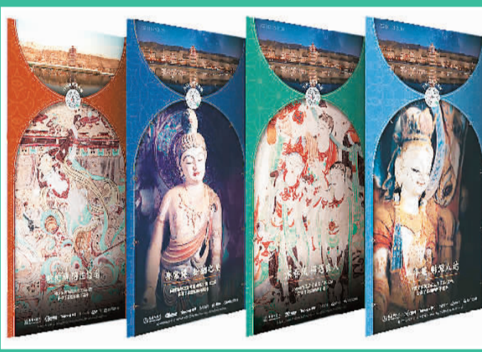
线上复原一千年前莫高窟燃灯民俗的“点亮莫高窟”功能

博物馆的未来是什么样？在国际博物馆协会发布的2021年国际博物馆日主题海报上，带着虚拟眼镜的人物头像格外醒目，清晰勾勒出博物馆数字化趋势的未来图景。在新冠肺炎疫情仍然在全球持续蔓延的当下，数字化对于博物馆发展来说显得更为迫切与重要。近日，敦煌研究院、法国吉美博物馆和腾讯公司联合开展线上跨国研讨会，围绕“文物数字化的未来”“文物数字化共享、传播与保护”等议题进行深入探讨，与全球文博机构共同分享数字化发展的实践成果与经验。