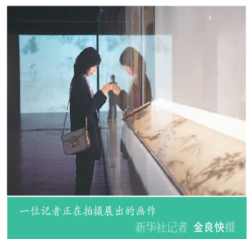
一位记者正在拍摄展出的画作