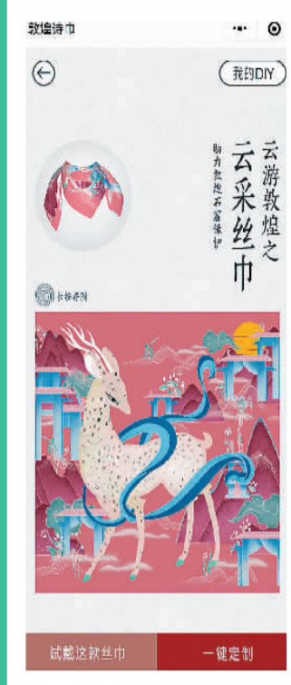
“云游敦煌”小程序 手机截图