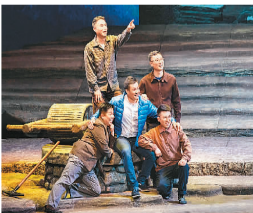
民族歌剧《马向阳下乡记》剧照

其中，张宽武的大型长卷《情系灾民》以宏大的叙事和构图讲述了发生在冬日火车站的感人故事，刘德生的《拼搏与奋斗》用连环画的形式生动记录了焦裕禄在兰考的475天，王银生的《冬夜》通过一把破旧的藤椅无声地诉说焦裕禄工作时的坚持，王清健的《咱老百姓的好书记》用熟练严谨的笔法描绘了焦裕禄与人民群众促膝谈心的情景。“弘扬焦裕禄精神美术作品巡展”旨在搜集、整理和创作出体现焦裕禄精神的美术作品，在全国不同地区巡回展出，以弘扬和传播焦裕禄精神。此次展览是巡展的收官之作。