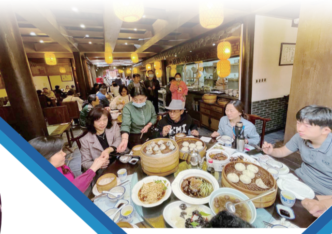
▲“五一”期間揚州早茶店人氣火爆。