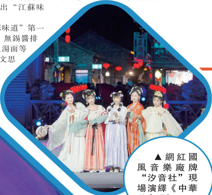
▲網紅國風音樂廠牌“汐音社”現場演繹《中華美食頌》

市商務局人士介紹，2021中國淮揚菜美食節活動內容主要包括揚州美食集市、儀徵美食展覽展銷、第十屆螺螄大衆美食旅遊節暨 第三屆揚州蜜蜂文化旅遊節 等多個活動。