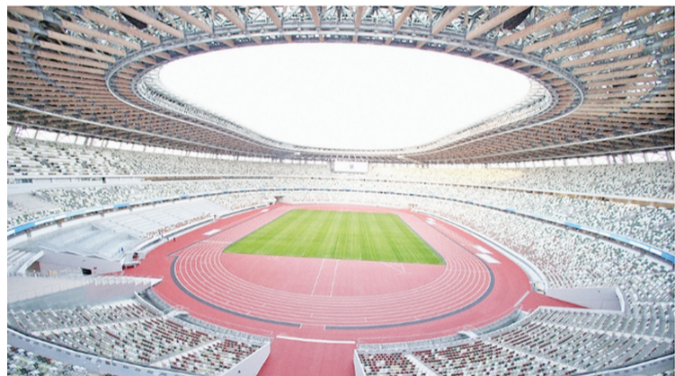
约130万张票分配给全国的自治体。

东京奥运会和残奥会是否有观众,观众上座率几何,会在6月时根据疫情来判断。由于日本目前国内反对奥运会举办的呼声很高,为了不让奥运会停办,零观众方案逐渐被认可。但东京奥组委有人士提出,即使没有观众,也要邀请孩