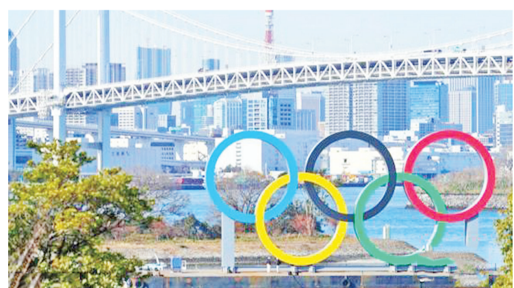
资料图:当地时间2月10日,日本东京,台场海滨公园展示奥运五环,迎接即将到来的东京奥运会。

集团创始人三木谷浩史表示,在日本国内疫苗接种非常不充分的情况下,举办庞大的国际赛事非常危险。软银集团总裁孙正义认为,在国际和日本疫情都面临不确定的当下,东京奥运会能否举办需要划上问号。