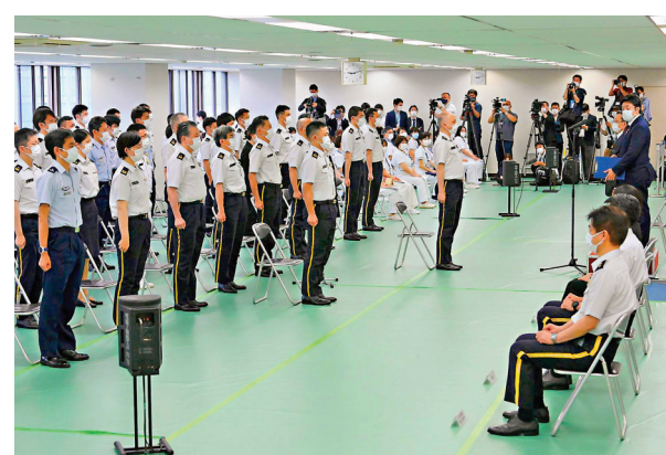
● 自衛隊在東京接種中心做準備。