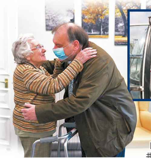
● 英國第三階段解封，有職員加強為地標「倫敦眼」消毒(上圖)。左圖為護老院院友與親屬共敘天倫。