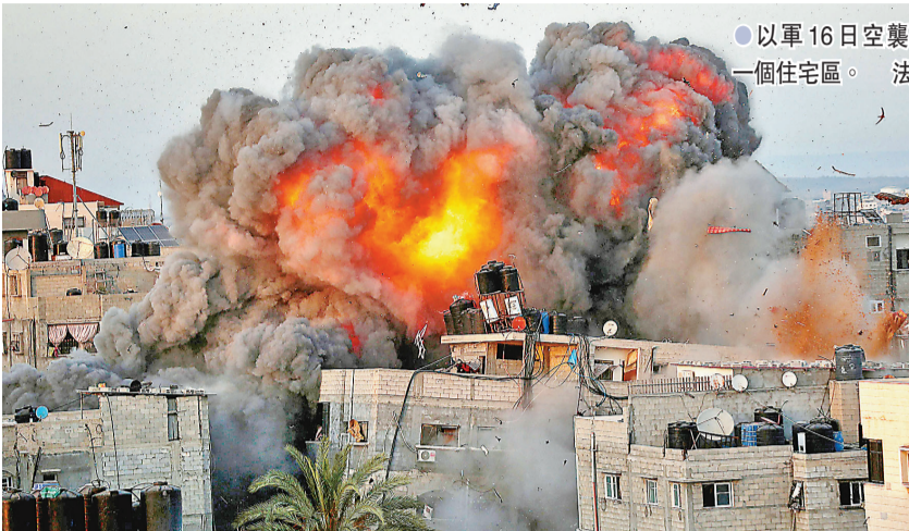
●以軍16日空襲加沙一個住宅區。

與會代表感謝中方主持召開此次會議，普遍呼籲巴以雙方立即停火止暴，遵守有關安理會決議和國際法，推動局勢降溫。巴勒斯坦外長馬勒基表示，巴方不能坐視以色列單方面採取行動，呼籲國際社會採取有力措施，制止以方非法行徑。