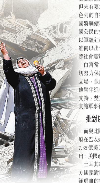
●婦人在廢墟前向天嚎哭。