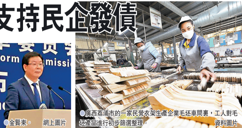
●廣西荔浦市的一家民營衣架生產企業毛胚車間裏，工人對毛胚產品進行初步篩選整理。

金賢東表示，在支持民營企業參與國家重大戰略的方面，加強與重點國家和地區工商領域社團及駐華機構的交流合作，繼續支持引導民營企業參與「一帶一路」建設；支持民營企業以需求為導向，積極投資建設集中式或分布式新能源、大容量儲能設施，開展「風光水火儲一體化」、「源網荷儲一體化」示範項目建設，為實現碳達峰碳中和發揮重要作用。