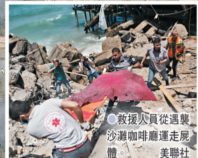
●救援人員從遭襲沙灘咖啡廳運走屍體。美聯社