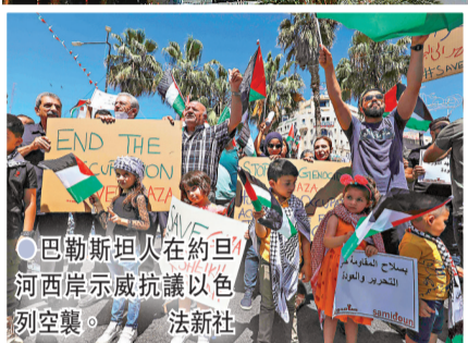
●巴勒斯坦人在約旦河西岸示威抗議以色列空襲。