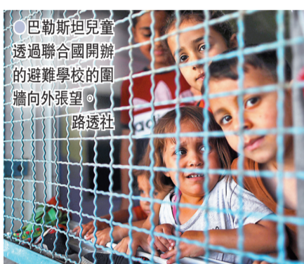
●巴勒斯坦兒童透過聯合國開辦的避難學校的圍牆向外張望。

王毅表示，以色列和巴勒斯坦衝突不斷升級，造成包括婦女和兒童在內的大量人員傷亡，形勢十分危急嚴峻，國際社會必須緊急行動起來，全力阻止局勢進一步惡化，全力防止地區再陷動盪，全力維護當地人民生命安全。他又說，巴勒斯坦問題始終是中東問題核心，中東不穩、天下難安，只有全面、公正、持久地解決巴以衝突，中東地區才能真正實現持久和平及普遍安全。