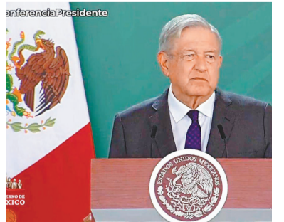
●墨西哥總統洛佩斯就「托雷翁慘案」大規模屠殺華人事件，正式向中國以及墨西哥華人社群道歉。

香港文匯報訊 綜合報道：當地時間5月17日，墨西哥總統洛佩斯就「托雷翁慘案」大規模屠殺華人事件，正式向中國以及墨西哥華人社群道歉。當時，發動墨西哥革命的隊伍在托雷翁殺害了303名華人。