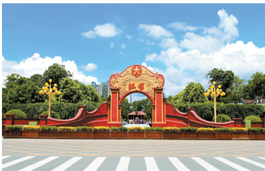
海豐縣紅宮紅場是中國首個縣級蘇維埃政權誕生地。

紅宮紅場作為首批全國重點文物保護單位、全國愛國主義教育示範基地，全國紅色旅遊經典景區，慕名前來緬懷彭湃烈士、瞻仰中國第一個蘇維埃政權誕生地的遊客也逐年增加。日前，記者走進紀念館，海豐農會會旗、海豐總工會印戳、彭湃題詞等珍貴文物，《勝利會師》《浴血奮戰》《氣壯山河》等大型群雕，海陸豐革命烈士紀念牆……述說着波瀾壯闊的革命史章。在紅宮紅場，記者還看到許多前來參觀的遊客，其中不乏來自省內外遊客。他們三五成群或瞻仰