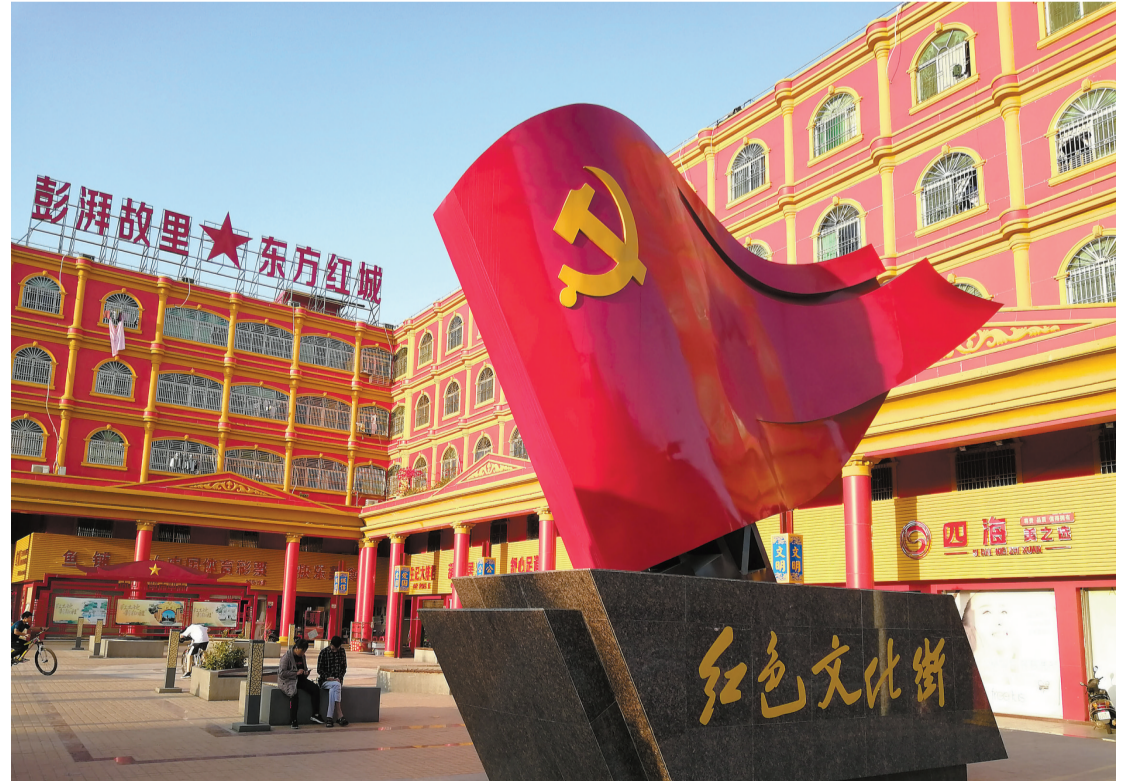
紅色文化街成為海豐縣新的「紅色名片」，帶動紅色旅遊商機。

級，紅宮紅場與周邊紅色主題街區，紅色主題街景融為一體，長約2.1公里紅色文化街已成為傳承彭湃故里紅色基因、建設「東方紅城」的重要載體，成為海豐新的「紅色名片」。