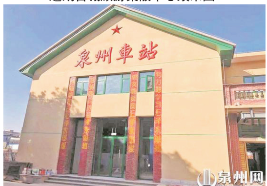
改造後的泉州舊車站主體大樓基本保持原有蘇式建築風格

4月23日，作為泉州古城生態修復城市修繕“七個一”工程的“一站”，泉州舊車站改造項目主體工程通過竣工驗收。這意味着，這個泉州市區最老的車站主體改造已完成，重裝後將作為古城旅游集散中心再出發。