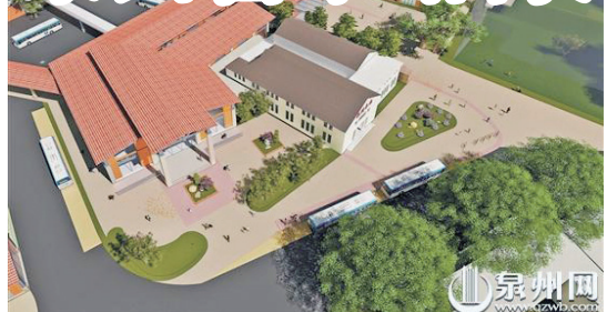
遠期古城旅游集散中心效果圖