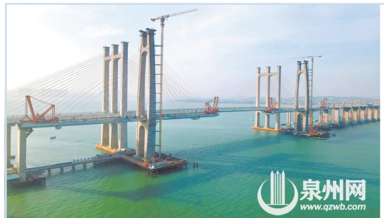
福廈客專泉州灣跨海大橋南輔助跨已成功合龍

5月3日，泉州灣跨海大橋南輔助跨(廈門側)順利合龍，標志着大橋向主橋貫通又邁進了一步。