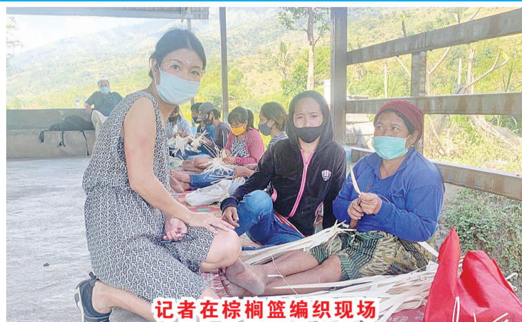
记者在棕榈篮编织现场

Muntigunung 区坐落在巴厘岛东北部加朗阿森县, 历史上一直被视为巴厘岛最贫困地区之一。之前 36 个村庄约 6000 多名常住人口(近 1200 户家庭)每年 5 月至 12 月旱季由于地势原因, 几乎没有天然水源, 迫使当地人民每日花费近 5 小时步行去最近的巴杜儿水湖取水; 除此之外, 由于贫困导致人民普遍营养不良, 文盲等无任何工作机遇使得此地区人口大量在巴厘各街头进行乞讨。