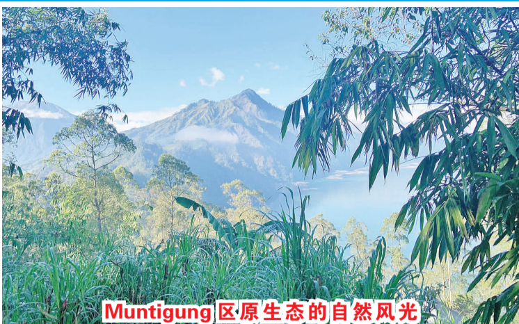
Muntigunung 区原生态的自然风光