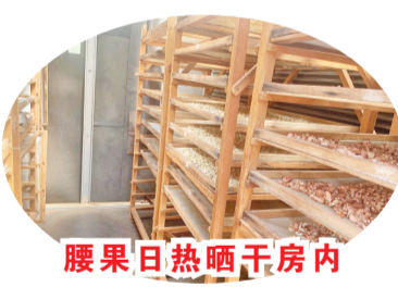
腰果日晒晒干房内