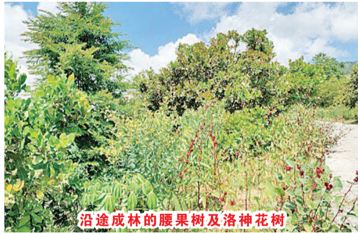
沿途成林的腰果树及洛神花树