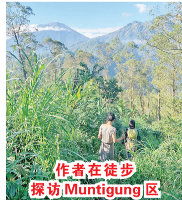
作者在徒步探访 Muntigunung 区