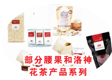
部分腰果和洛神花茶产品系列