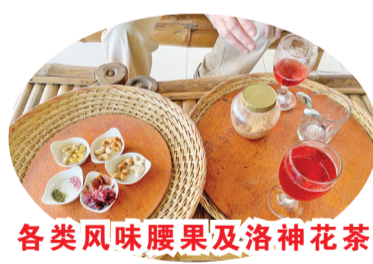
各类风味腰果及洛神花茶