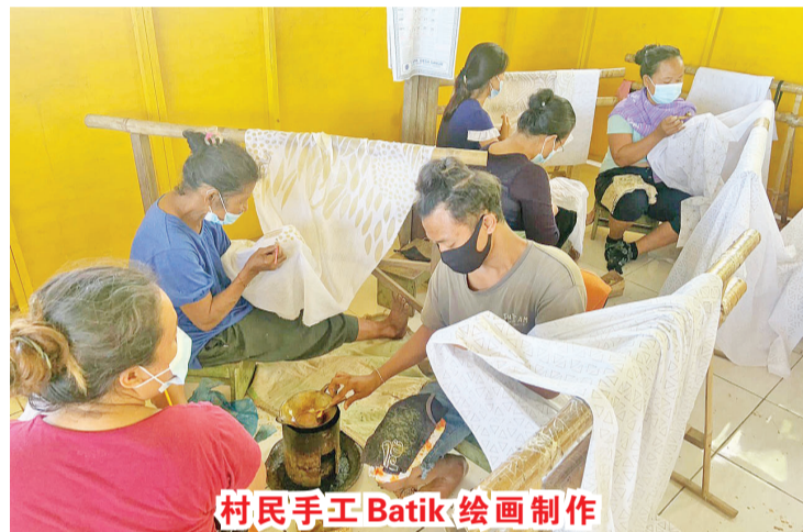
村民手工 Batik 绘画制作