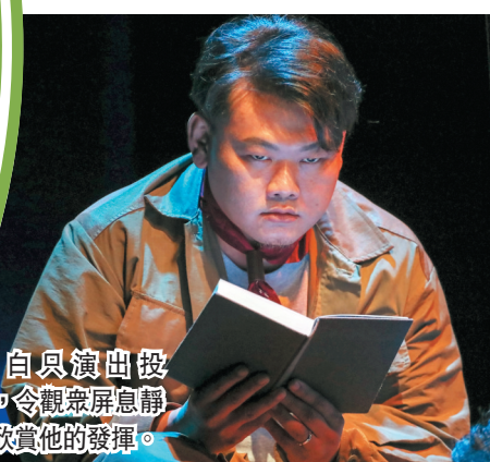
● 白只演出投入，令觀眾屏息靜氣欣賞他的發揮。

朱柏康就話場地雖有入場人數限制，但感覺與滿座分別不大，笑言享受「關閉處所」的時光：「因為可以畀我哋靜落嚟，慢慢感受吓劇本、點做戲，呢個係得！」