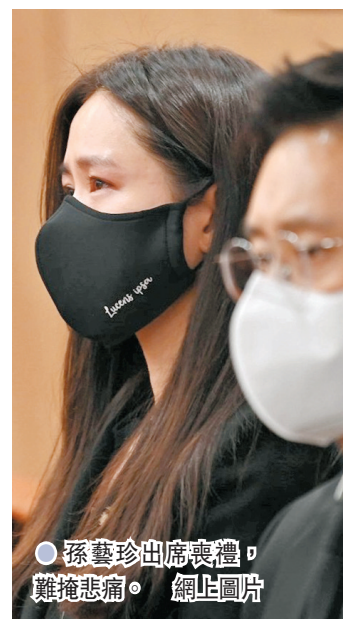
● 孫藝珍出席喪禮，難掩悲痛。