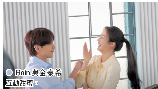
● Rain與金泰希互動甜蜜。