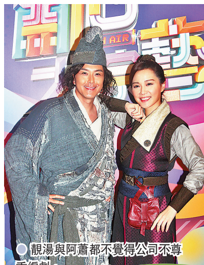
● 靚湯與阿蕭都不覺得公司不尊重編劇。

說：「平時拍劇時真係會現場臨時執生，尤其拍笑片會有啲微調，因為有時啲對白同劇情到演嘅時候唔配合，有少少改動都唔奇。(可覺得擅自改劇本會唔尊重編劇?)如改到出來效果，相信編劇都會明白，但自己唔會改個大橋。」提到前編劇又投訴因有得跟場，所以被人改劇本都唔知?阿蕭指這是公司一直來的做法：「一向都係各有各，但絕對唔會唔畀編劇跟場，反而好歡迎佢哋嚟，好肯定節目中所指個男主角係我，因自己絕對唔會加戲，反而會減戲，爆料人無指名道姓係邊個男演員，都講唔到乜嘢，最緊要拍劇時睇現場需要。」