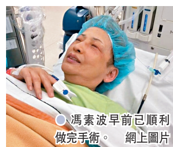
● 馮素波早前已順利做完手術。

波姐為馮寶寶的姐姐，以童星身份進入娛樂圈，一直熱衷於演藝事業，未來還會參與新劇《痞子殿下》及《雙生陌生人》的拍攝工作。