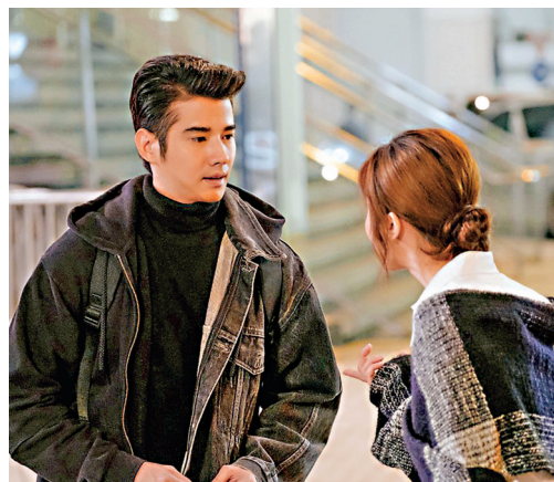
● 馬里奧與阿Sa在電影中有不少對手戲。