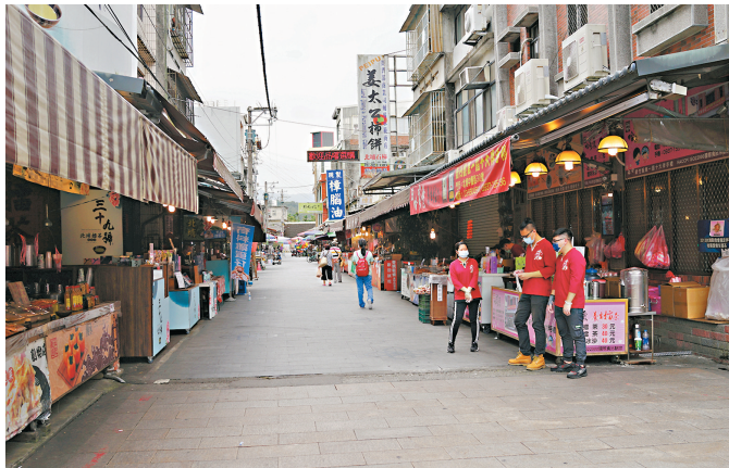
往日人潮絡繹不絕的新竹縣北埔老街遊客減少，只剩下零星幾人。