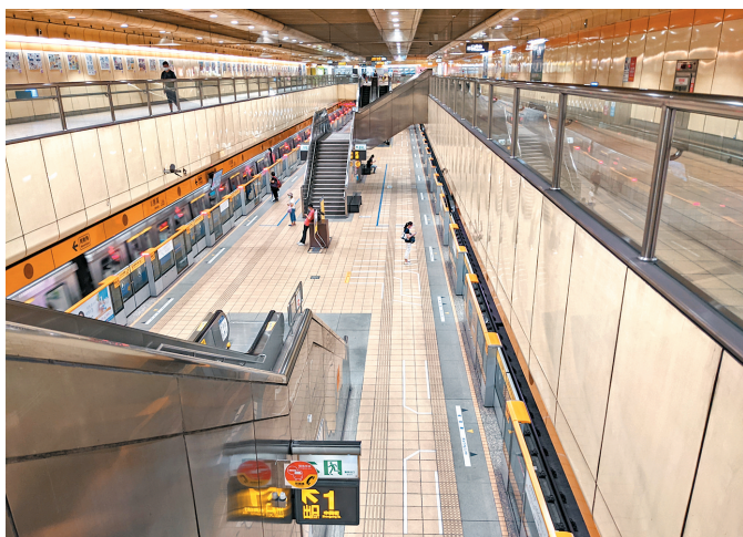
5月16日的台北捷運站內空蕩蕩。