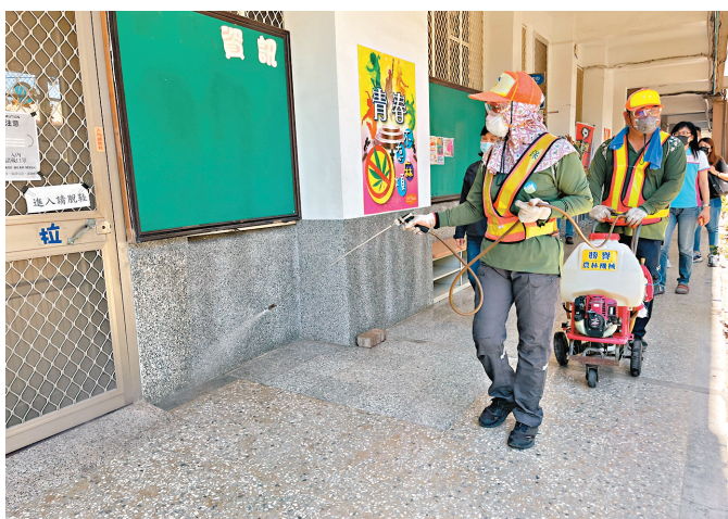
高雄市環保局16日到高雄左營高中校園內進行消毒。