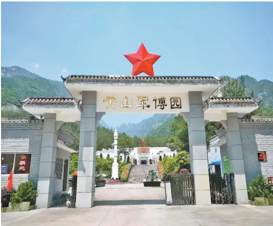
中墩村石門崗的紅軍北上抗日先遣隊陳列館（黃山軍博園）。

黃山區譚家橋鎮相關負責人介紹，譚家橋鎮將依託紅色資源優勢，深入挖掘紅色歷史，繼續實施粟裕將軍墓、聶家山革命老區環境整治工程，改造提升紅色遺址和紅軍北上抗日先遣隊陳列館等。其中，推進中墩村實施紅色廣場建設、紅軍戰壕環境整治等項目17個，按照「基層黨建+美麗鄉村+全域旅游」的思路，將田園風光、紅色資源、黨建文化和鄉村旅遊有機結合，打造「山青水綠陣地紅」的美麗村莊。