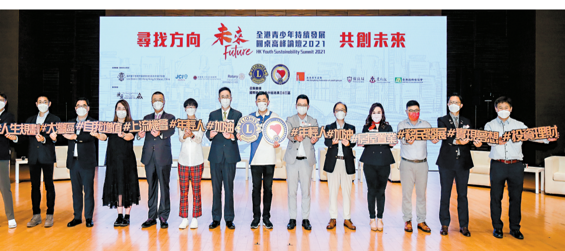
一眾嘉賓主持由獅子會聯同本港8間社福機構協辦、「未來」全港青少年持續發展圓桌高峰論壇2021 啓動儀式。

理解與80、90年代已截然不同，過往不少人期望能當老闆、飛黃騰達，但時下青少年則較重視改善自己生活，對生活要求較高。又指幫助青年不應只針對大學生，認爲非大學生同樣須支援，特別是缺乏技能培訓的青年。