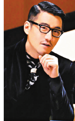
● 胡兵為中國航天加油！

至於台灣演員陳妍希亦在有關「天問一號」的帖文下方第一時間點讚支持，默默祝賀「天問一號」登陸火星。而2004年雅典奧運會女排冠軍趙蕊蕊就在新華社官方微博報道「天問一號」探測器成功著陸的消息帖文下點讚支持，表示祝賀。