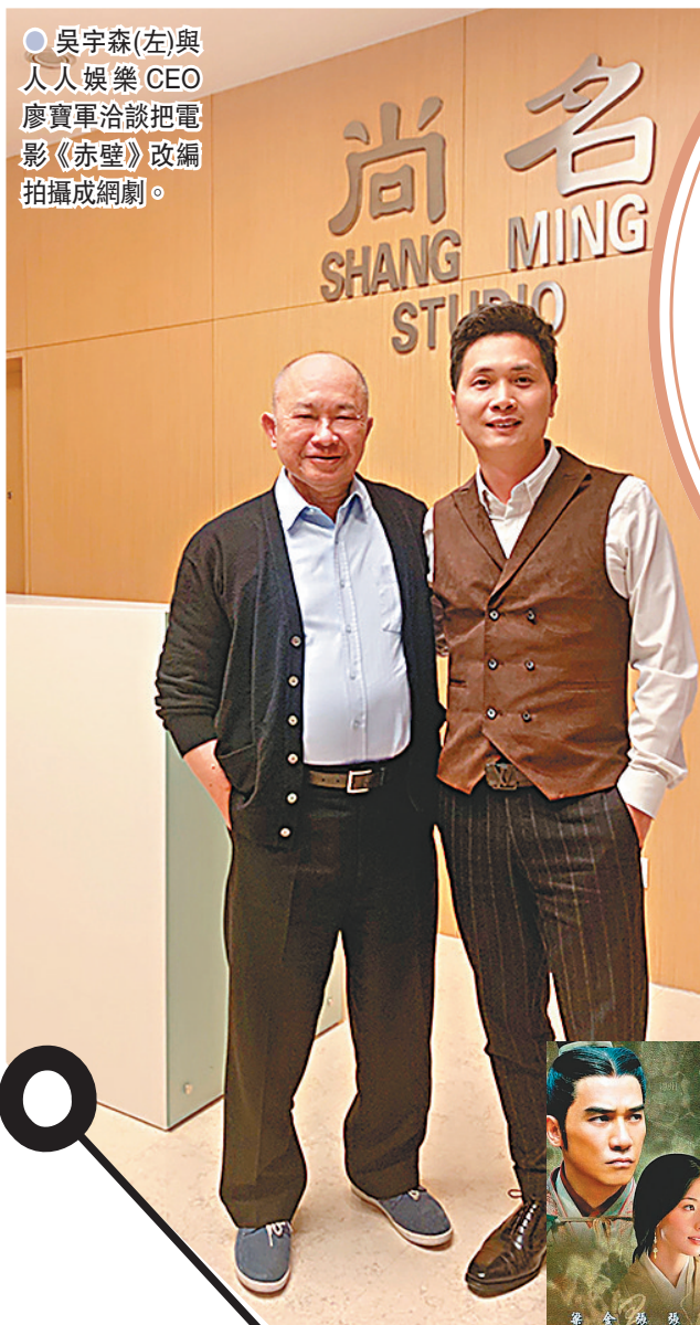
● 吳宇森(左)與人人娛樂 CEO 廖寶軍洽談把電影《赤壁》改編拍攝成網劇。

香港文匯報訊 國際知名導演吳宇森執導的電影《赤壁》於2009年上映，當年除了票房不俗外，亦讓吳宇森斬獲第67屆威尼斯電影節金獅獎終身成就獎、第12屆上海國際電影節華語電影傑出貢獻獎等多個國際獎項，近日有消息指吳宇森與人人娛樂CEO廖寶軍在洽談把電影《赤壁》改編拍攝成超級大網劇，並希望邀請梁朝偉、林志玲等原班人馬再度合體出演。