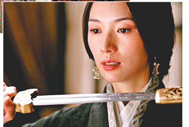
● 林志玲扮演的小喬讓人印象深刻。

張震收到入圍消息後表示：「非常榮幸能夠入圍台北電影節。《緝魂》這部戲，是導演、監製、合作的演員以及台前幕後的工作人員，共同花費很長的時間去準備和拍攝的成果，大家都為此付出了很多的心血。我非常幸運可以參與到這部作品中。感謝導演、監製以及所有的工作人員，也感謝觀眾和評審對我在這部戲裏表演的認可。希望《緝魂》這次可以取得好成績，也希望大家平安健康，謝謝。」