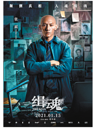
● 張震為拍《緝魂》減掉25磅。