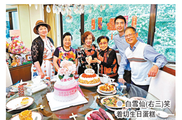
● 白雪仙(右三)笑着切生日蛋糕。

香港文匯報訊(記者阿祖)粵劇名伶白雪仙(仙姐)將於本月19日邁向93歲壽辰，日前仙姐的友好到其跑馬地逸廬豪宅，預早為仙姐賀壽。陳淑芬兒子陳家豪亦有份出席拜會並分享與仙姐的合照，仙姐雖已超過90高齡，但看來精神飽滿，臉色紅潤，親切生日蛋糕時還展露笑容。一班好友送上生日蛋糕祝仙姐「仙壽恒昌」，家豪亦留言：「祝仙姐93歲生日快樂，身體健康。」