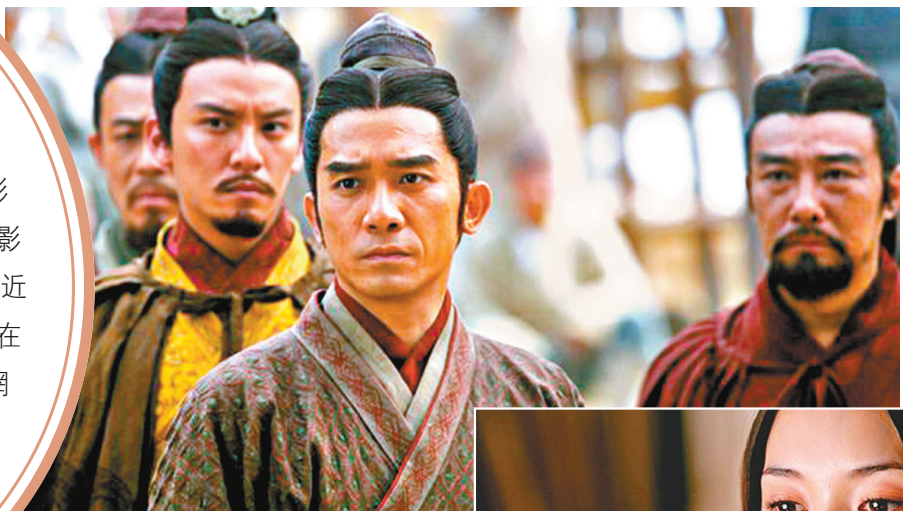
● 吳宇森希望原班主角再度出演。

節金獅獎終身成就獎和第12屆上海國際電影節華語電影傑出貢獻獎；電影獲得第13屆中國電影華表獎優秀合拍片獎、美國拉斯維加斯影評人協會最佳外語片和日本每日電影大獎最佳外語片並入選《電影看中國》。