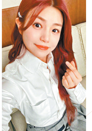
● 陳妍希默默祝賀「天問一號」登陸火星。