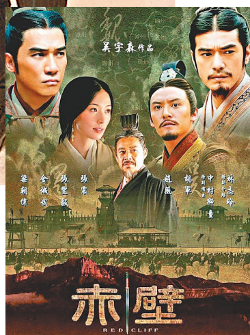
● 電影《赤壁》眾星雲集。

電影《赤壁》由吳宇森執導，金城武、梁朝偉、張震、林志玲主演，此次若將《赤壁》拍攝成網劇，吳宇森和廖寶軍也希望邀請原班多位主角再度合體出演。