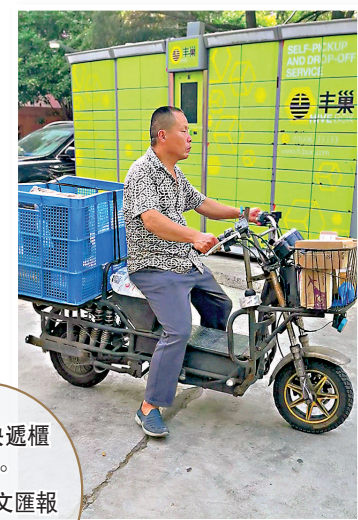
路過快遞櫃的快遞員。

其他公司業績也都全線下降，申通去年淨利潤同比減少24%至43.12億元；韻達減少46.94%至14.04億元。