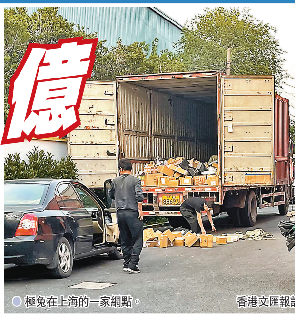
極兔在上海的一家網點。