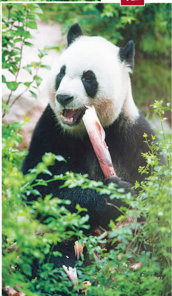
左上图：市民在澳门大熊猫馆看望大熊猫“心心”。 上图：大熊猫“健健”在吃竹笋。