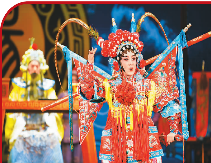
▲表演者在演绎粤剧传统排场戏《六郎罪子》。

作赛启动仪式”在这里举行，粤港澳三地的粤剧名家线上线下参与，共同见证这一粤剧曲艺界的盛事。不少粤剧新生代接班人登台亮相，将创新和流行元素融入粤剧经典剧目。在他们的演绎下，粤剧焕发新魅力，吸引许多年轻观众，正在成为粤港澳大湾区的一张文化新名片。