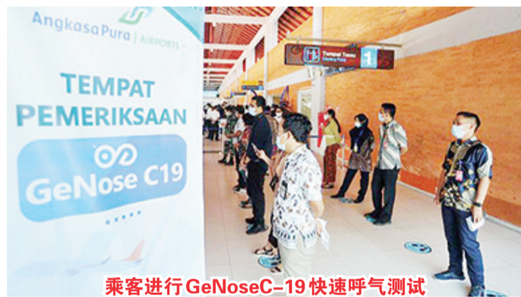
乘客进行GeNoseC-19快速呼气测试