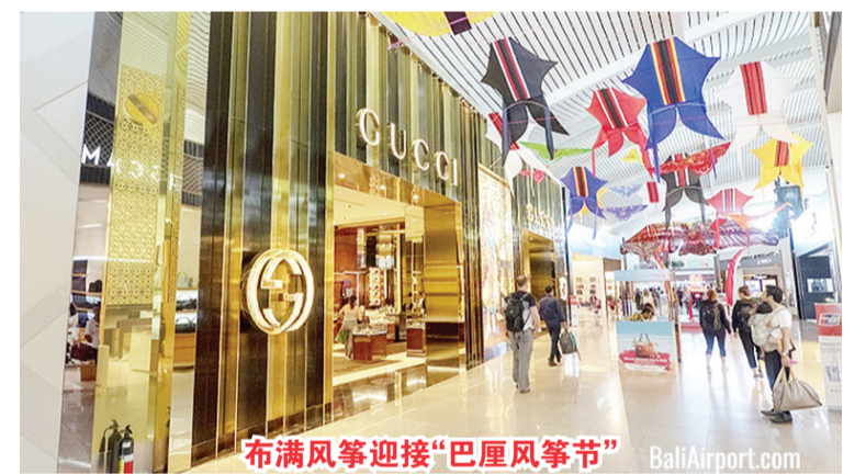
布满风箏迎接“巴厘风箏节”

答：目前虽只针对国内航班进行开放，但近几个月国内游客到访巴厘岛还是非常乐观，且从巴厘岛前往雅加达、泗水、望加锡、棉兰的航班也非常频繁。今年三月起比二月增长了68%，四月份也比同年增长了16%，因此5月中旬穆斯林新