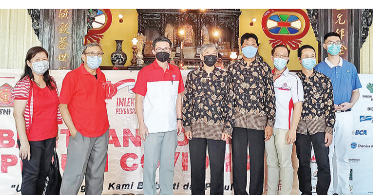
在文庙分发礼包后理事们合影

有10公斤大米和口罩的大米将在斋月期间分发。希望它能给居民带来关怀和关心的感觉。”