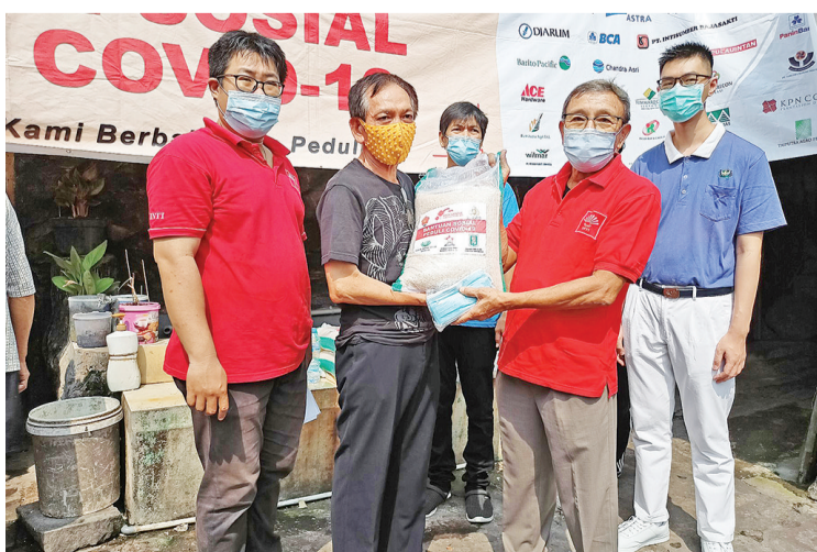
INTI 东爪哇周礼岳主席分发礼包