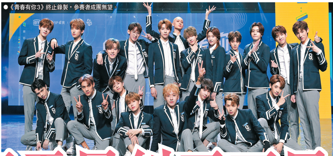
《青春有你3》終止錄製，參賽者成團無望。