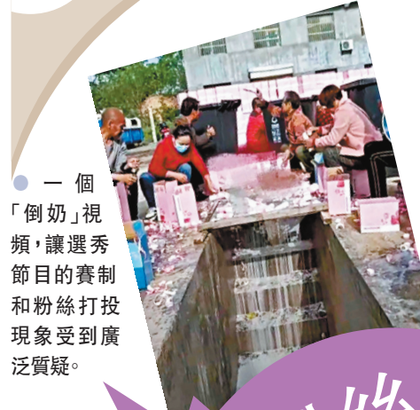
一個「倒奶」視頻，讓選秀節目的賽制和粉絲打投現象受到廣泛質疑。