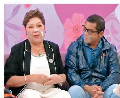
肥媽的47歲兒子現身《日日媽媽聲》給驚喜。

問到是否因TVB改革後減少煮食節目，她要轉移陣地改在網上平台教煮餸？肥媽說：「畀時間佢哋改革啦，以前