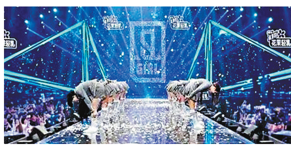
近幾年內地選秀節目大行其道。