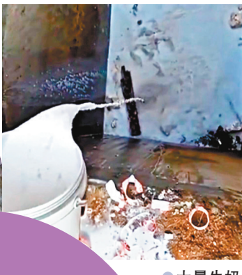
大量牛奶被浪費倒掉。