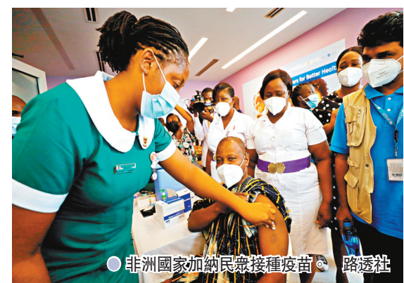
● 非洲國家加納民眾接種疫苗。