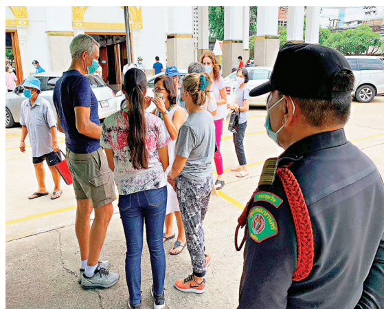
● 泰國的外籍居民查詢疫苗接種事宜。