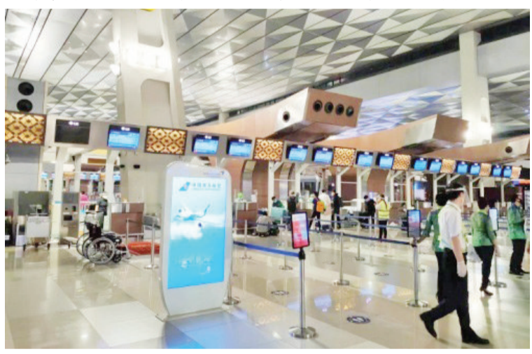
南航雅加达值机柜台