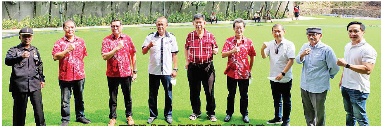
百家姓成员与色特拉度达成员合影