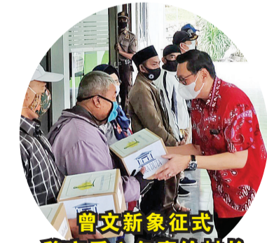
曾文新象征式移交爱心包裹给村长