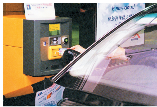
現在不少停車場都沒有收費員及崗亭。