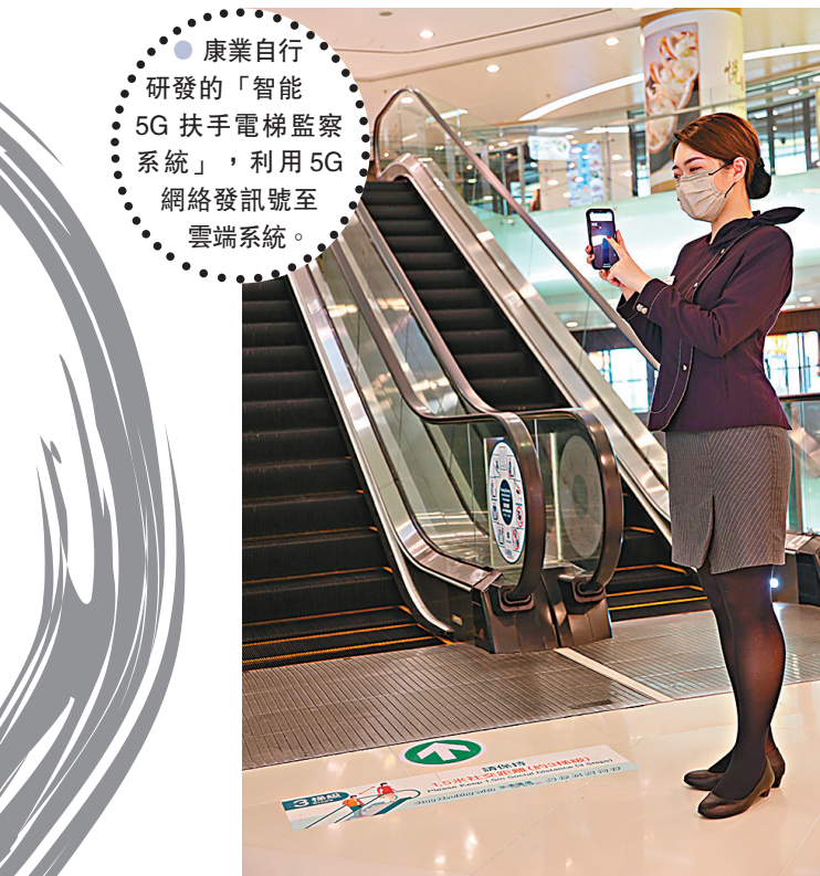
康業自行研發的「智能5G扶手電梯監察系統」，利用5G網絡發訊號至雲端系統。