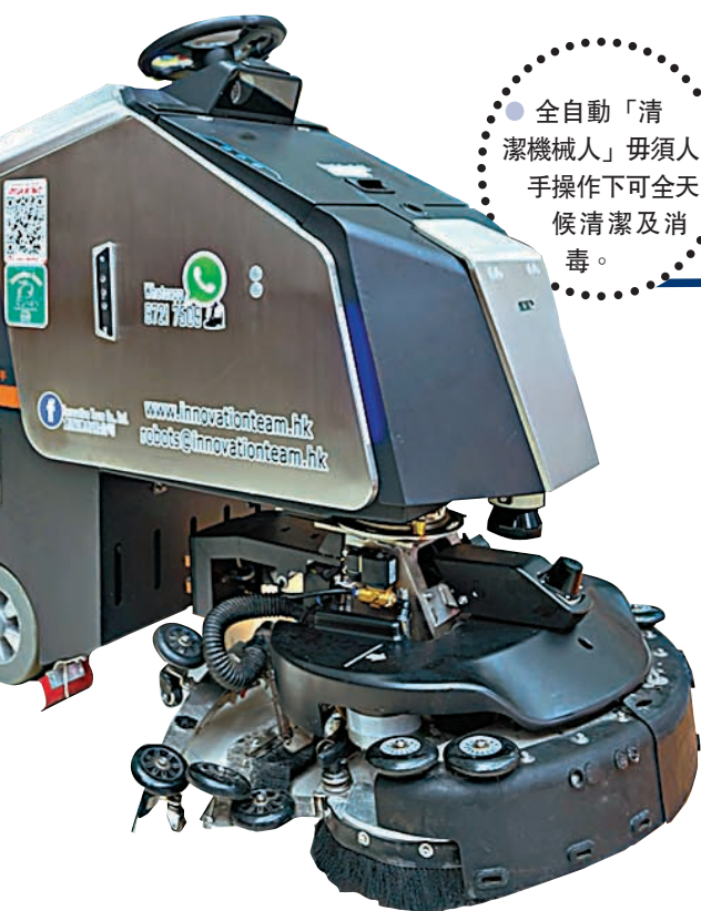
全自動「清潔機械人」毋須人手操作下可全天候清潔及消毒。