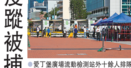
愛丁堡廣場流動檢測站外十餘人排隊檢測。

張建宗指出，5月1日至7日期間，全港已為超過28萬名外備採樣，另有超過5萬名外備已預約8日至9日在檢測中心接受檢測，加上估計有4萬名外備已接種兩劑新冠疫苗而毋須再強檢，相信絕大部分外備可在限期前接受檢測。