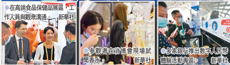
在高端食品保健區，工作人員與觀眾溝通。