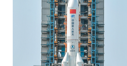
圖為中國空間站天和核心艙與長五B遙二運載火箭組合體。中新社

香港文匯報訊 中新社報道：據中國載人航天工程辦公室消息，經監測分析，北京時間2021年5月9日10時24分，長五B遙二運載火箭末級殘骸已再入大氣層，落區位於東經72.47°，北緯2.5°周邊海域，絕大部分器部件在再入大氣層過程中燒蝕銷毀。