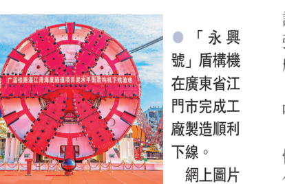
「永興號」盾構機在廣東省江門市完成工廠裝運順利下線。

作為廣東建設里程最長、投資最大的高鐵項目，廣湛高鐵路是構建「一核一帶一區」區域發展新格局的有力支撐，採用單洞雙線盾構隧道。