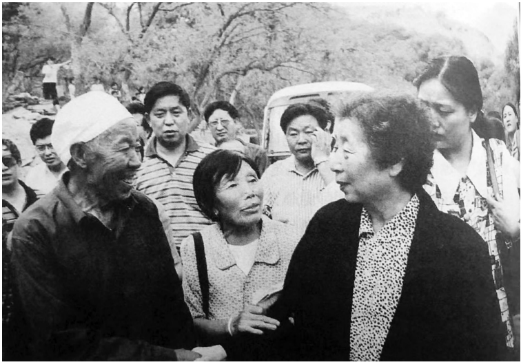
2000年夏天，齐心回到郝家桥村看望乡亲。