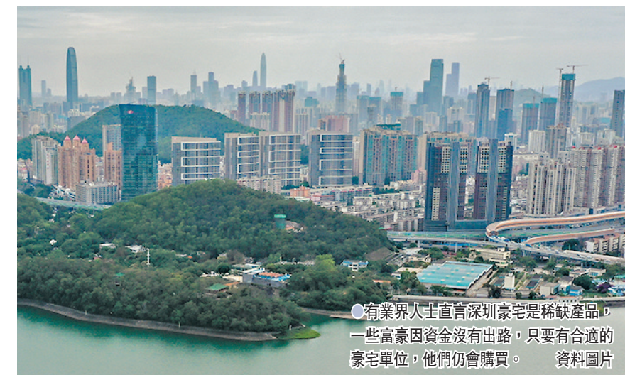
●有業界人士直言深圳豪宅是稀缺產品，一些富豪因資金沒有出路，只要有合適的豪宅單位，他們仍會購買。 資料圖片