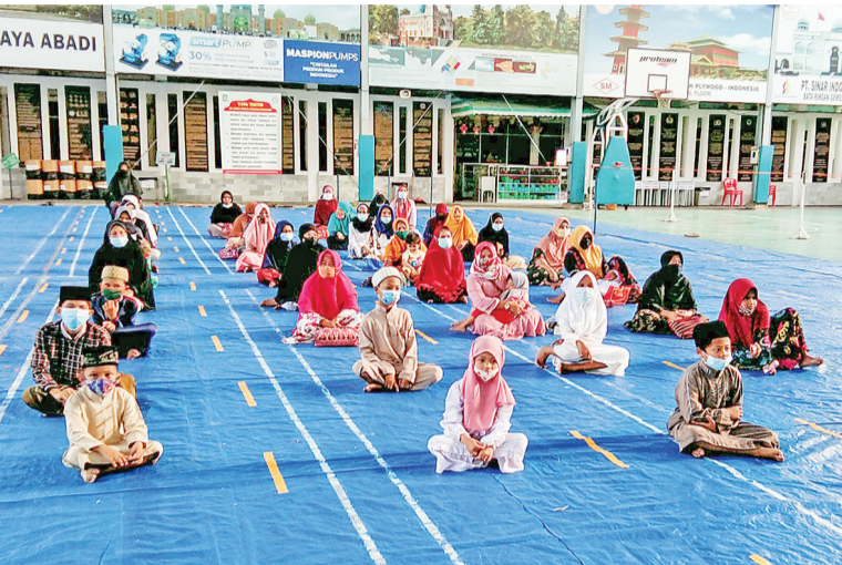
孤儿与贫困居民有序地等候领取爱心礼包